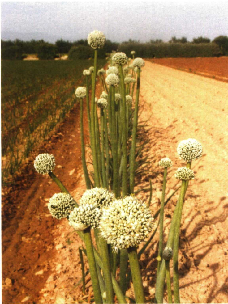
Cebollas dejadas para semilla