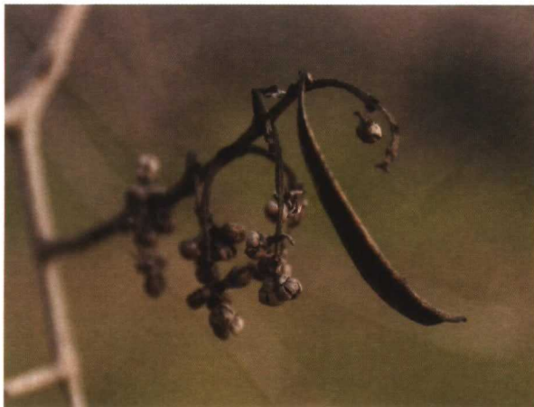
Detalle de flores momificadas (tras diez meses), algo frecuente en los olivos afectados