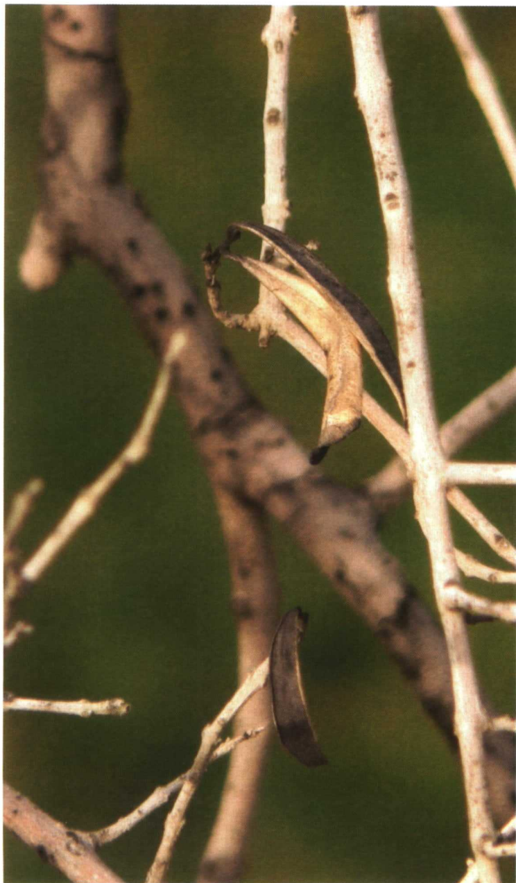
Ramas secas por la verticilosis y un problema secundario que suele acarrear, el barrenillo