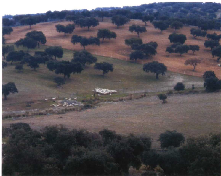
El majadeo ha sido la forma secular de mejora de pastos de la dehesa