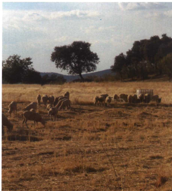
El uso racional de bebederos portátiles, saladeros, etc. permite orientar las querencias del ganado y sirve para la creación de majadales

fincas con mano de obra asalariada en las que la jornada laboral transcurre de las 8:00h. a las 18:00h. tener al ganado metido en el redil durante 14 horas es excesivo, por ser contrario al bienestar animal. No ocurre así en los rebaños familiares, en los que no hay una jornada establecida.