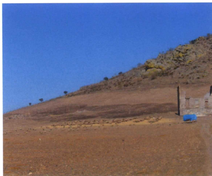
..... Obsérvese el cambio de color de la tierra donde ha estado el majadal, a la izquierda de las ruinas

Aunque hay pastólogos que amplían el uso del término majadal a los pastos más o menos nitrófilos que se dan en los descansaderos del ganado extensivo (incluidos los pastos de puerto), en términos pascícolas los majadales están compuestos por especies anuales y vivaces de escasa altura (menos de 10cm), aunque de gran calidad nutritiva y adaptadas al pastoreo del ovino (de ahí su pequeña talla). La Poa bulbosa y el Trifolium subterraneum ocupan aproximadamente el 90% de la superficie del majadal en los suelos silíceos, que es donde más abundan los majadales, y especies de los géneros Medicago y Astragalus sustituyen al Trifolium subterraneum en los suelos básicos. La sobrecarga de ganado permite una amplia difusión de estas especies: por una parte favorece la difusión tanto de las semillas de la Poa bulbosa –unas cariopsis duras, indigeribles, difundidas con las heces del ganado– como de sus bulbillos radicales, que sirven como elementos colonizadores, al ser desprendidos y vueltos a enterrar durante el invierno gracias al pisoteo que entraña la sobrecarga sobre terrenos húmedos. Por otra parte el majadeo favorece la difusión de las semillas de leguminosas, aunque el Trifolium subterraneum tiene capacidad de autosiembra, como si enterrara sus semillas.