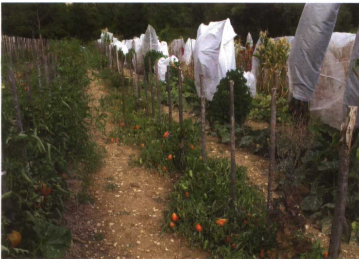
El huerto de Kokopelli se encuentra en el Parque Natural Regional de Verdon, cerca de Manosque

“Si cogemos una especificidad francesa, el Catálogo Oficial, desde 1905 –en un siglo– hemos perdido el 95% de las variedades, de la biodiversidad vegetal. Esto está