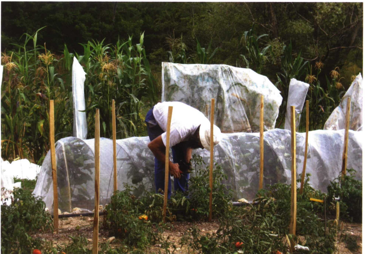
Raoul en el huerto. Desde antes de la fundación de Kokopelli ya tenía interés por guardar semillas antiguas