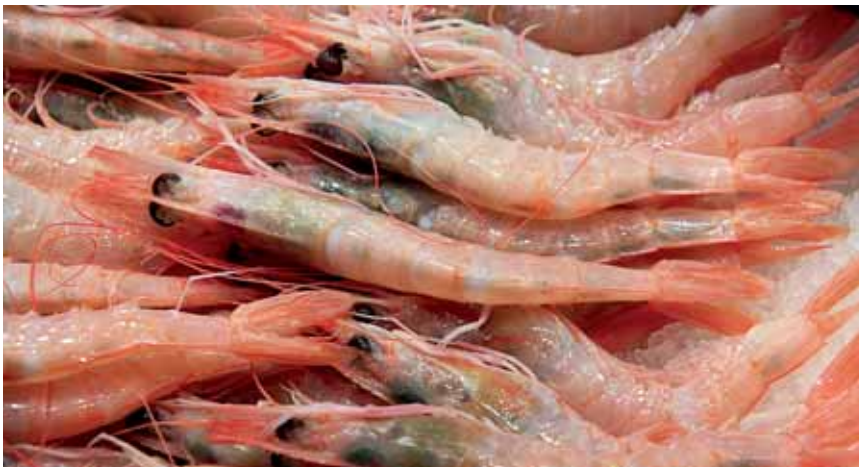
Gamba blanca de Huelva.

El final de esta cuarta y última ruta será Matalascañas , en el término onubense de Almonte, una playa inmensa donde ponerse a tono con unas finísimas coquinas y unos platillos de la exquisita gamba blanca de Huelva . Para reflexionar el viaje y sus peripicias, una visita al Museo del Mundo Marino y un lo que apetezca en la Taberna Tío Paco . Tiene aje. ■