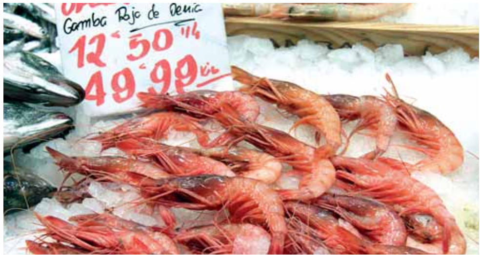
Gamba roja de Denia.

Pinatar , en la comarca natural del Campo de Cartagena y en la embocadura del Mar Menor que es, y no por casualidad, donde se pesca el notabilísimo langostino del Mar Menor . Antes de hincarle el diente, el viajero deberá visitar la Casa del Reloj y el Palacio de los Condes de Villar de Felices o "Casa de la Rusa" o de la Marquesa, o del Barón de Benifayó, un edificio ecléctico de finales del siglo