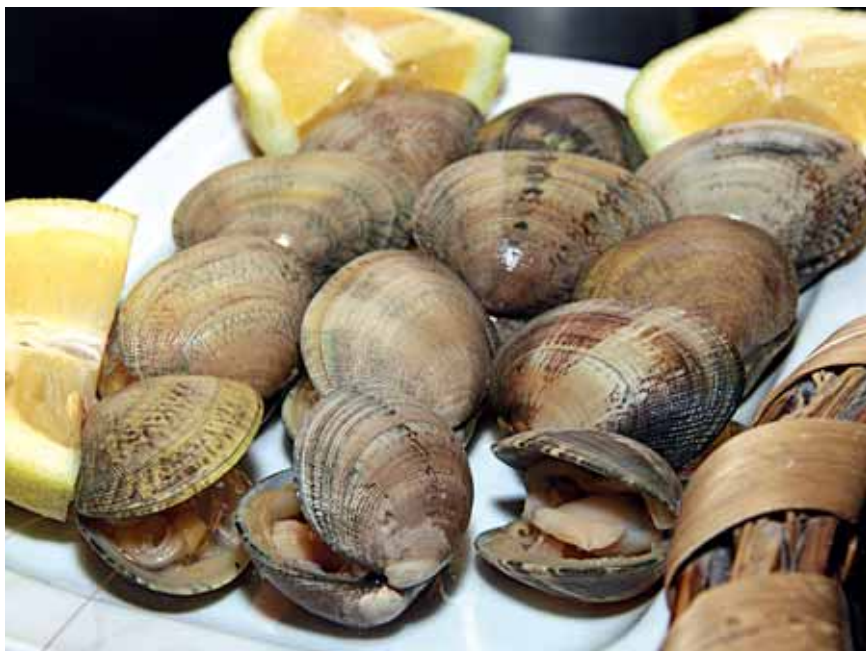
Almejas de O Carril.

meca del choco , cuya fiesta celebran el segundo fin de semana de mayo, y que puede degustarse en tinta, a la manera de Redondela, con arroz o a la marinera con ajada en crudo.