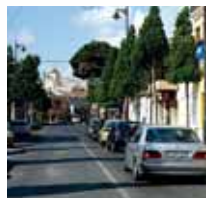
San Pedro del Pinatar.