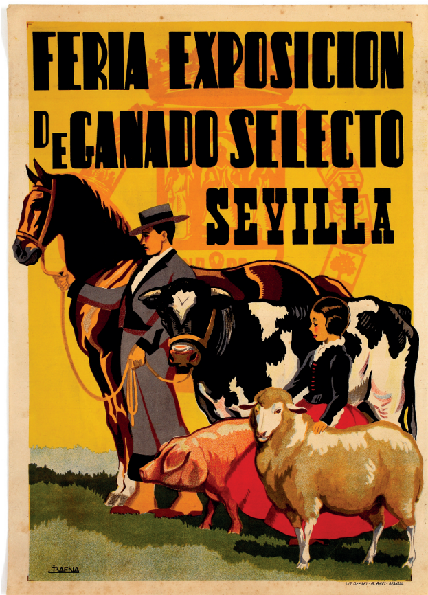
Feria Exposición de Ganado Selecto Sevilla. J. Baena [1930]. Papel litografiado. 35,5 x 49,8.

■ El cartel aquí recogido es de los años treinta, y está firmado por el conocido ilustrador andaluz Baena, siendo un buen ejemplo de la unión entre unas imágenes atractivas y la realización de un tipo de actos como éste, el de las ferias, exposiciones, concursos y muestras de todas clases (en este caso, ganaderas), que trataban de presentar lo mejor y más actual del bien o producto anunciado.