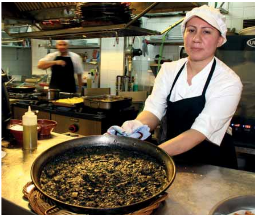
Restaurante El Cañar. Madrid.

La continua liberalización en la comercialización de alimentos, que aparece como resultado de los acuerdos entre los grandes bloques económicos internacionales, llega hasta el sector arrocero y se traduce en un menor esfuerzo en la producción y, por el contrario, una mayor atención hacia la adquisición del producto en terceros países para posteriormente dedicarse a la transformación y comercialización. Los productores europeos están centrando su actividad en ofrecer un producto que