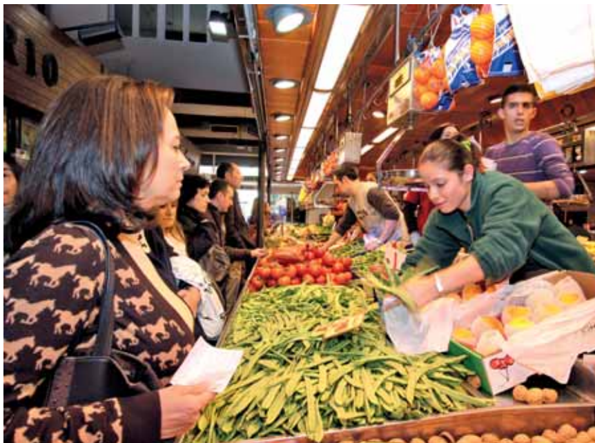
Mercado de La Paz. Madrid.

La enorme variedad existente en la familia de las hortalizas supone que la demanda se fragmente y que los distintos productos cuenten con una participación