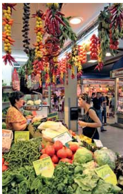
Mercado del Olivar. Palma de Mallorca.