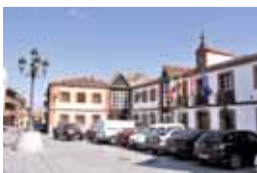
San Agustín de Guadalix.