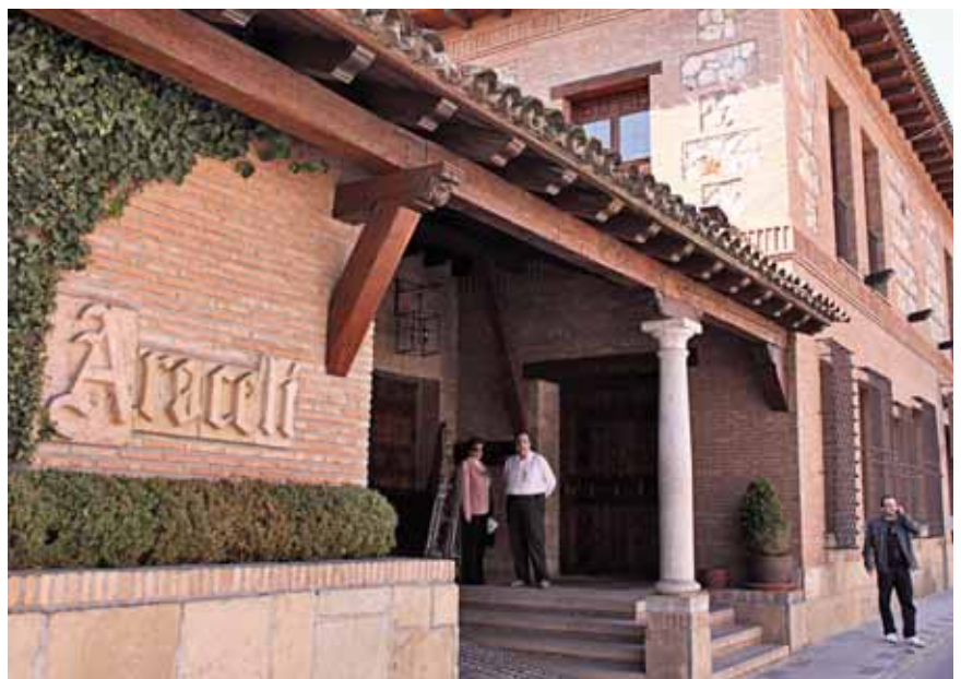
Restuarante Araceli. San Agustín de Guadalix. Madrid.

Primer alto en Manzanares el Real , en el Parque Regional de la Cuenca Alta del Manzanares, dominado por La Pedriza imponente y su Yelmo impertérrito, ensismado en