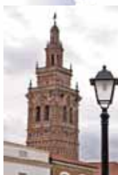
Jerez de los Caballeros.