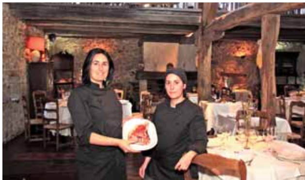
Restaurante Baserri Maitea. Forúa. Vizcaya.

De Tolosa a Orreaga/Roncesvalles , que es sitio de paso natural a la península, sustancial enclave jacobeo, enclave épico de La Chanson de Roland , y lugar que ni pintado para ponerse frente a la rica carne de vacas de razas Pirenaica, Blanca, Pardo Alpina,