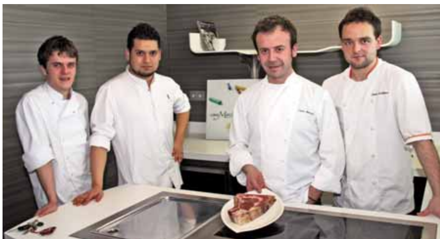
Restaurante Casa Marcial. La Salgar. Asturias.

Y de allí, para concluir el devaneo andariego, a Lalín , que es cruce de caminos y patria común de la mejor ternera y de un cocido donde se puede aprender geografía en la cabeza del cerdo. Para concluir con lo primero, que es a lo que el pregrino iba por esta ruta, nada mejor que regalarse y cuchipander de lo lindo en el Mesón o Cruce , que quizá ya puede resultar cargante, pero que de menos nos hizo Dios. ■