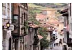
Santillana del Mar.