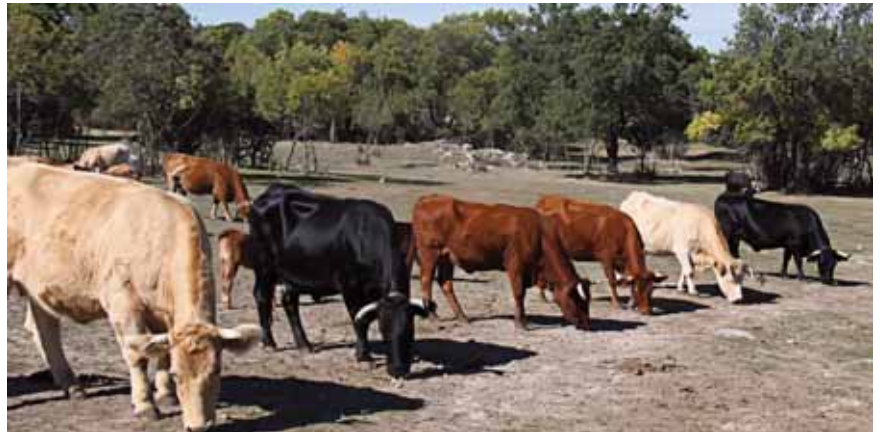
San Agustín de Guadalix. Madrid.