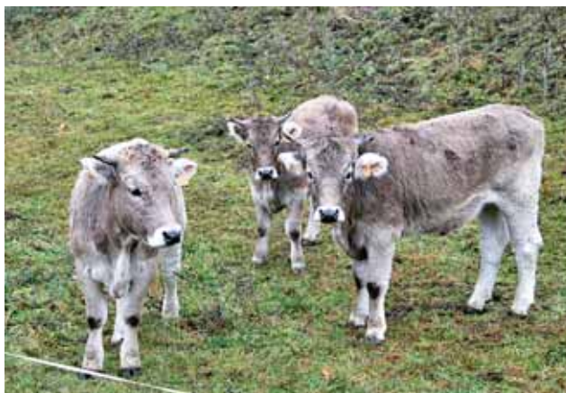
La Vall de Boi. Lleida.

Después de Jaca, la ruta se detiene en Sort-