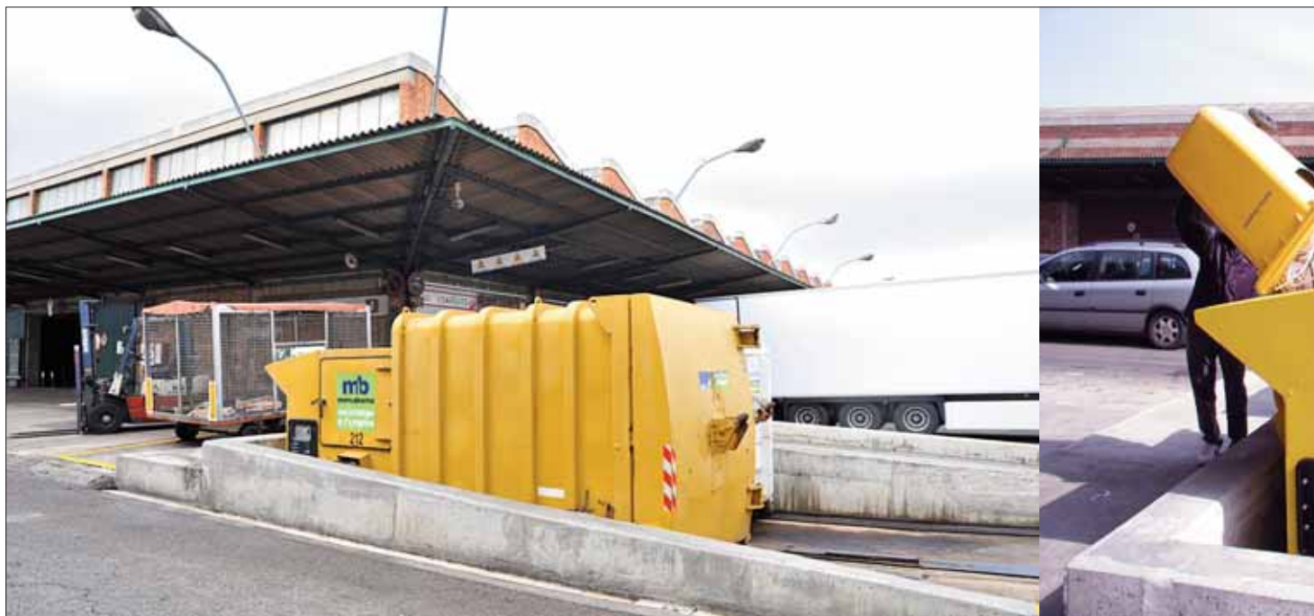
Imagen de los contenedores-compactadores situados en el Mercado Central de Frutas de Mercabarna.

tiva en los tres mercados mayoristas que hay en Mercabarna: Mercado Central de Frutas y Hortalizas, Mercado Central del Pescado y Mercabarna-Flor. Así, alrededor de los mercados hay instalados unos contenedores-compactadores para facilitar y hacer más cómoda la tarea de separación de los residuos de los mayoristas.