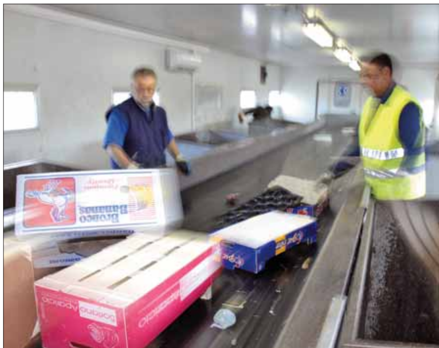
Zona de selección del Punto Verde de Mercabarna.