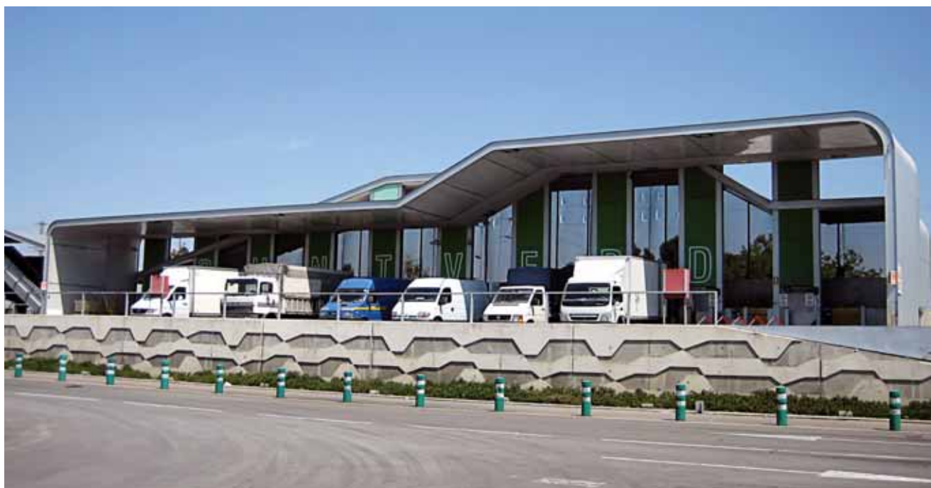
Imagen del Punto Verde de Mercabarna.

rie de infraestructuras y servicios para facilitarles la separación de los residuos generados por su actividad comercial.