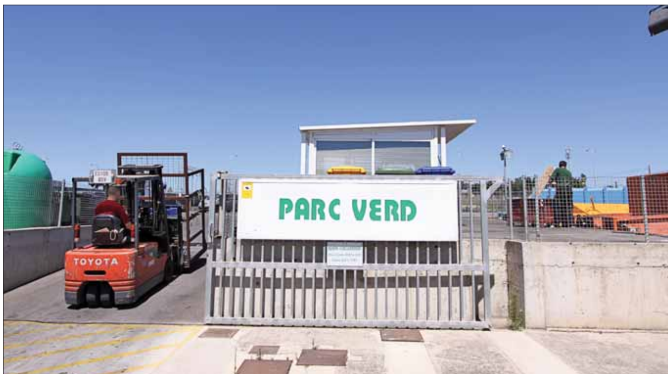
Parque Verde de Mercapalma.

donan al Banco de los Alimentos de Barcelona, una entidad que se encarga de repartir alimentos entre numerosas entidades benéficas que ayudan a los más necesitados.