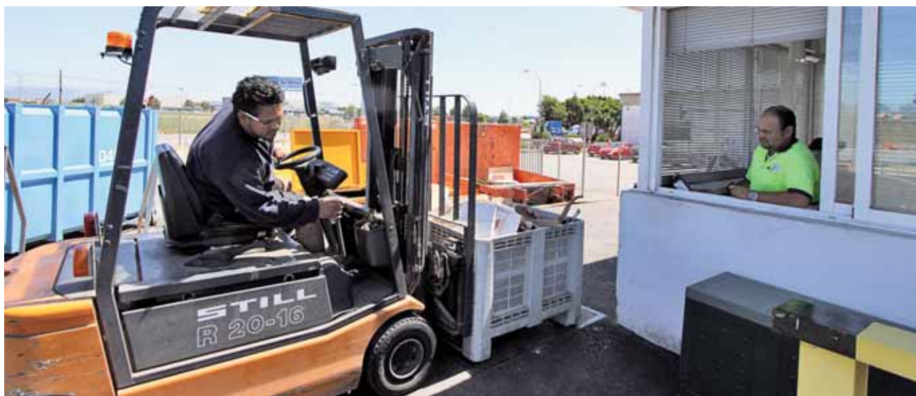
Parque Verde de Mercapalma.