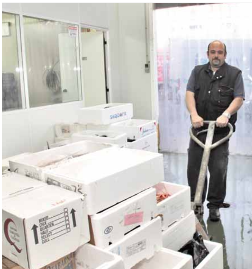
Distribución de pescados en Mercapalma.

Este problema se ha resuelto con esta nueva máquina, que tritura y prensa el porexpán, transformándolo en barras compactas. De esta manera se reduce su volumen y se optimiza para su transporte a una empresa gestora. Ya fuera del Punto Verde, esta empresa gestora limpia las barras de porex, las funde y las usa como plástico de segunda categoría, que sirve para fabricar, por ejemplo, perchas. Esta máquina puede reciclar hasta 200 kilogramos por hora. Actualmente, en Mercabarna se reciclan 110 toneladas de porex al año.