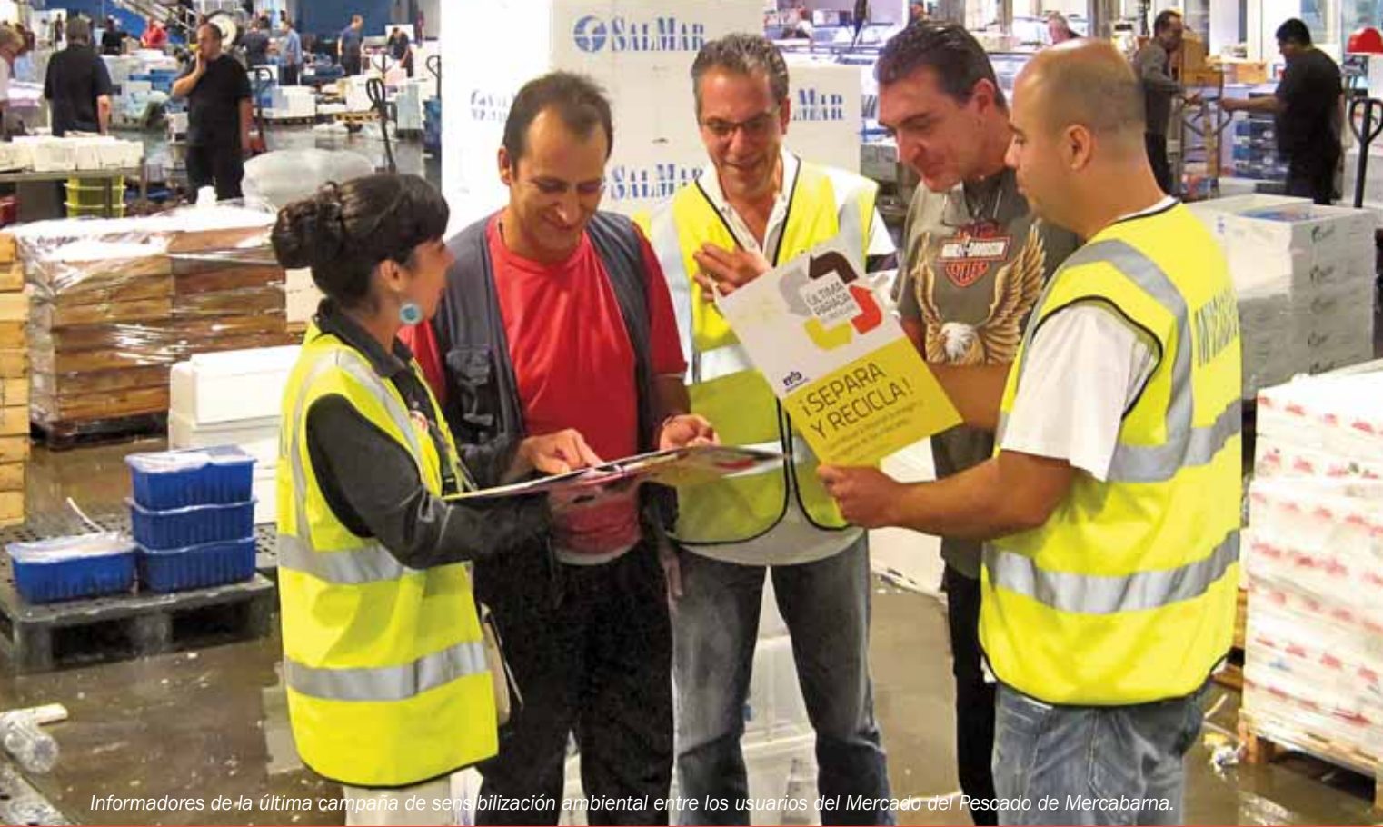
Informadores de la última campaña de sensibilización ambiental entre los usuarios del Mercado del Pescado de Mercabarna.