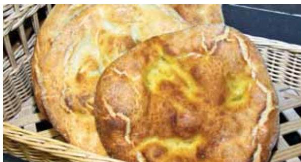
Torta de Aranda.

Bollo murciano. Cachirulo. Congo. Congrio. Crespillos. Estrella. Mona. Pan de artesa. Pan de carrasca. Pan de cuadros. Pan de es-piga. Pan de jeja. Pan de rigüelto. Pan sobao. Rollo de panza. Torna a añiura. Torta. Talvina (Mula). Trenza.