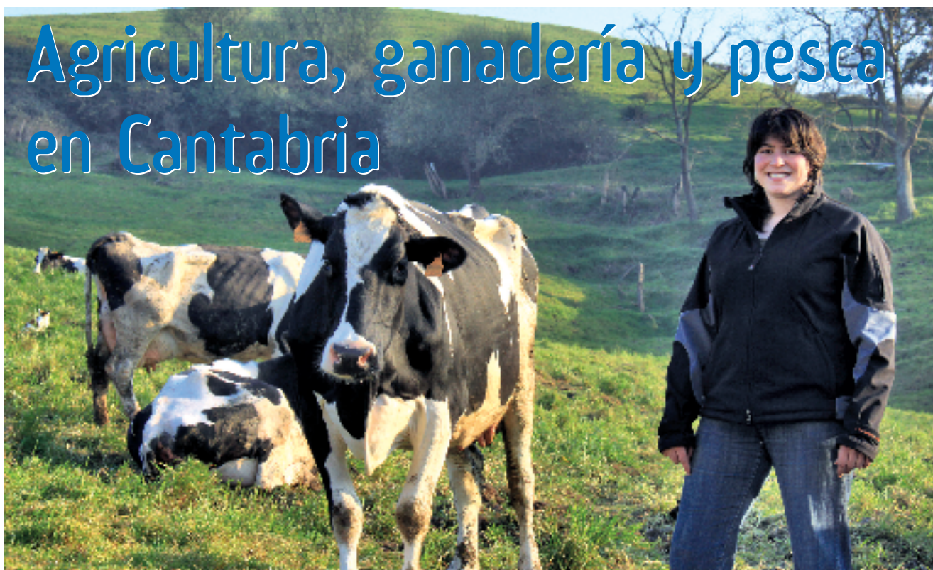
Explotación ganadera en Los Tanagos, Cantabria.

C antabria cuenta con un sector primario que ocupa en torno al 4,5% de la población activa. El valor de la producción de la rama agraria de Cantabria ascendió en 2008 a 276 millones de euros (precios básicos), de los que 239 millones correspondieron a la aportación del subsector ganadero.