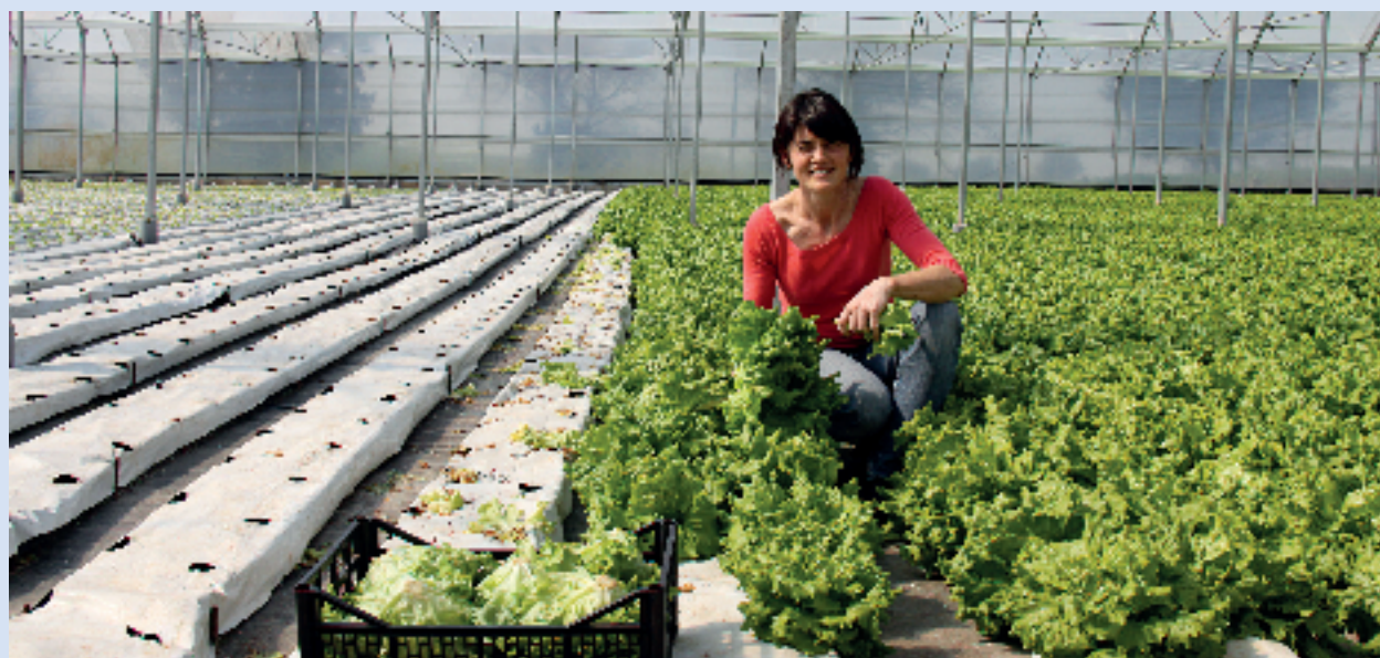
Invernadero en Orejo, Cantabria.