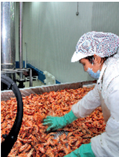
Industria pesquera en Mercasantander.

La comunidad autónoma de Cantabria participa, sobre el total nacional, con el 1,15% de las ventas de la industria alimentaria, el 0,98% en consumo de materias primas, el 1,53% en número de personas ocupadas y el 0,94% en inversiones en activos materiales.