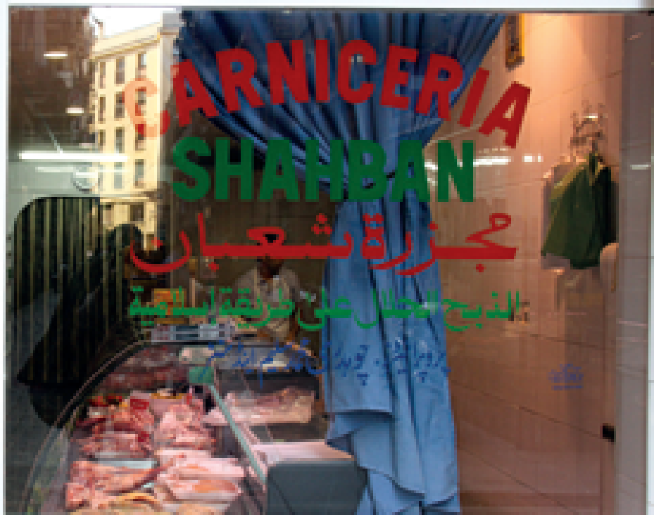
Carnicería en El Raval. Barcelona.