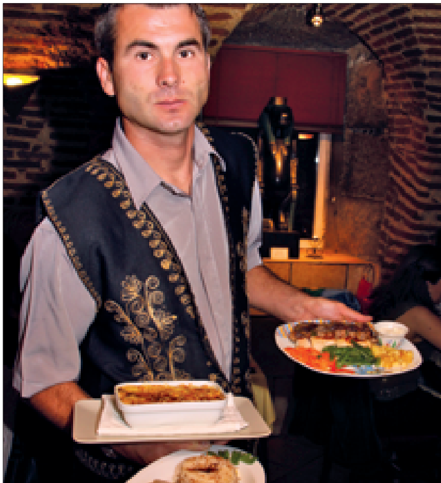
Restaurante La Cava del Faraón. Madrid.

nidad y la solidaridad reinante en el seno de la comunidad de creyentes; símbolos y representaciones del pecado, la gracia, la impureza, la contaminación o la polución, etc. La infracción de una norma dietética se ha interpretado, en algunas circunstancias, como un atentado contra el orden divino y las leyes que derivan de él, y la ausencia o dosificación rigurosa de alimentos se ha transformado en sacrificio o en una forma de autodisciplina dirigida a la obtención del favor divino.