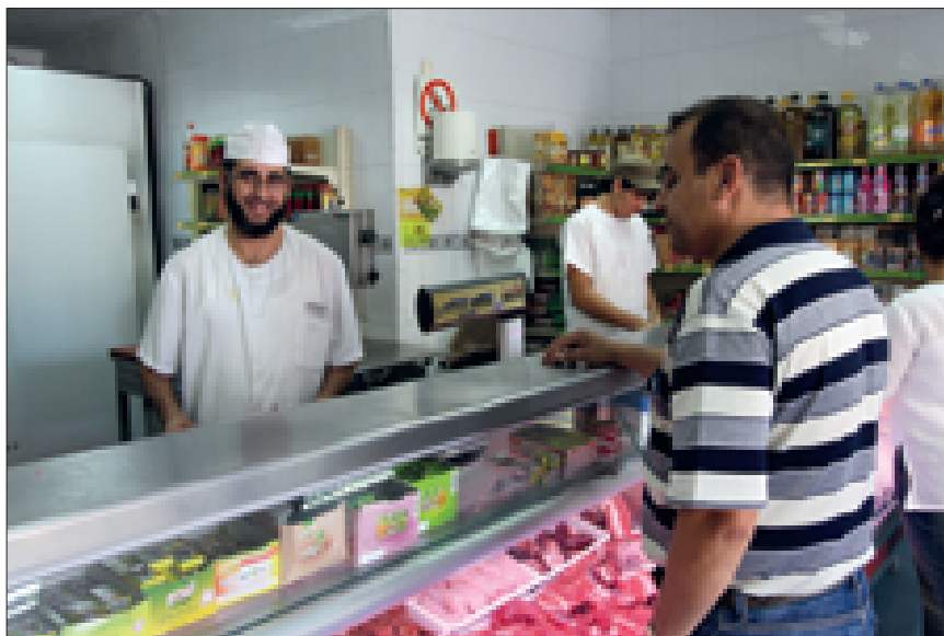
Carnicería Alhambra. Algeciras.

El ayuno durante el mes de ramadán es la segunda norma alimentaria de obligado cumplimiento para todos los musulmanes y uno de los pilares básicos del islam. En este caso, la expiación de las faltas adquiere connotaciones tanto ascéticas como sociales. La abstención sexual y el ayuno no son suficientes, hay que demostrar públicamente que no se violan estos principios. Las cafeterías, tiendas de comestibles, restaurantes y puestos callejeros cierran sus puertas o reducen su actividad al mínimo y los extranjeros o quienes se encuentran exentos de su cumplimiento por enfermedad, por encontrarse de viaje o por su condición deben guardar una total discreción y ocultarse cuando comen. La práctica del ramadán distingue y separa a los creyentes de quienes no lo son y se convierte en un rasgo de identidad y de fraternidad religiosa que convenientemente utilizado puede movilizar o estigmatizar a sus practicantes. A lo largo de este mes, los musulmanes pueden comprobar que realmente forman parte de una comunidad, umma ,