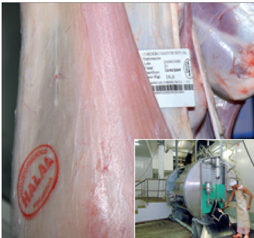
El Corte Inglés. Madrid.

Por establecer una comparación, los judíos practicantes del código alimenticio kosher , que en todo el mundo rondan los