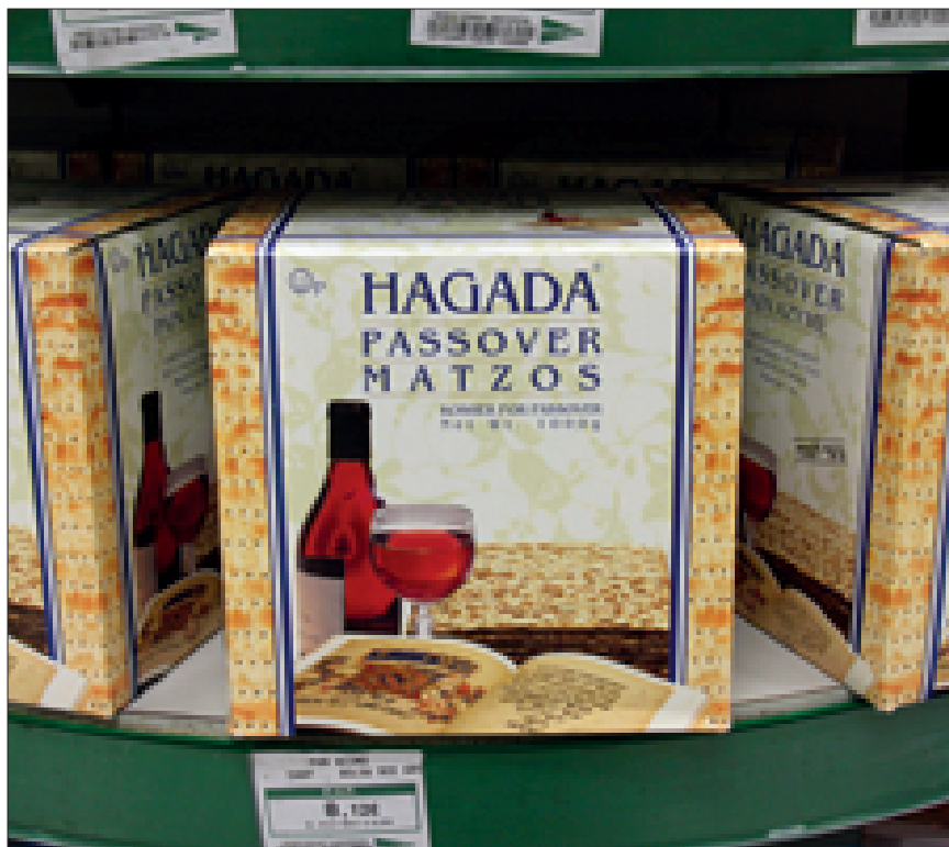
El Corte Inglés. Madrid.

cilitar su asimilación o digestibilidad, mejorar su sapidéz o incrementar su apetencia; de otro, la insaciable curiosidad del hombre junto con sus incursiones en la selección e hibridación de especies han incrementado exponencialmente el catálogo de alimentos aptos para el consumo.