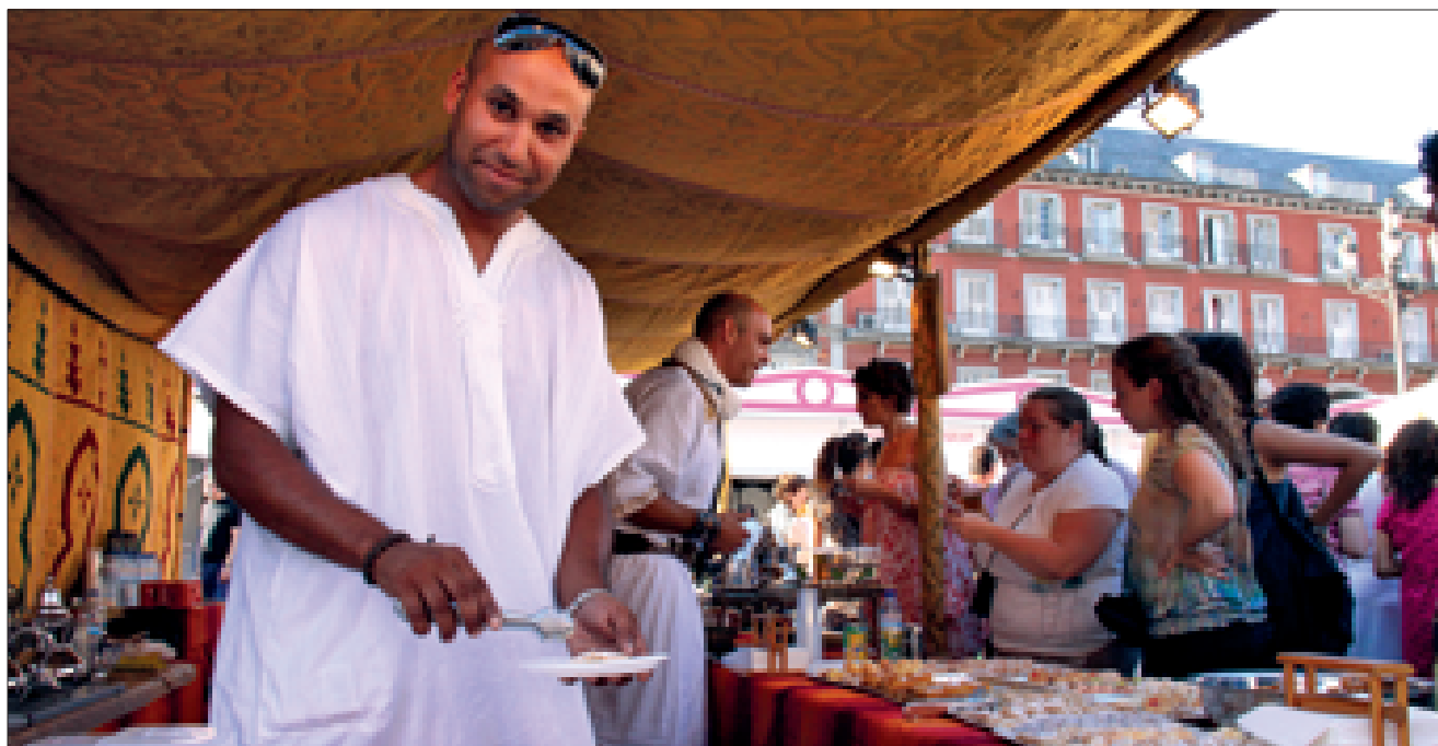
Degustación de comida marroquí en la Plaza Mayor de Madrid, junio de 2009.

doxia y corrigen las desviaciones, una visión particular del mundo y del papel que al hombre le toca jugar..