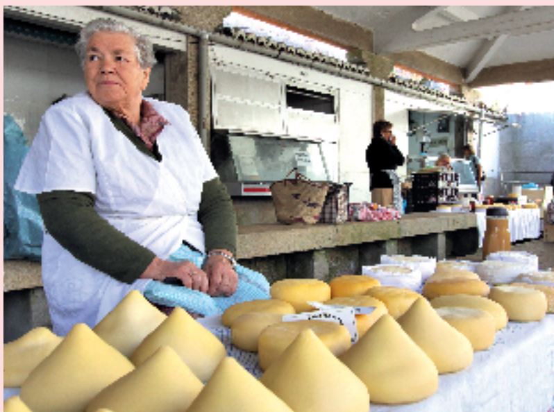
Mercado de Santiago de Compostela.

Durante el año 2008, el gasto en alimentación realizado por los establecimientos de restauración comercial y restauración colectiva y social en Galicia ascendió a 1.949,9 millones de euros (en torno al 9% del total efectuado en el conjunto del país). Destaca el consumo de 43,6 millones de kilos de carne, 22,8 millones de kilos de pescado, 14,4 millones de kilos de derivados lácteos, 33 millones de kilos de pan, 4 millones de kilos de platos preparados, 127,7 millones de litros de cerveza, 11,5 millones de litros de bebidas alcohólicas de alta graduación, 182,2 millones de litros de bebidas alcohólicas de baja graduación y 101,2 millones de litros de bebidas refrescantes.