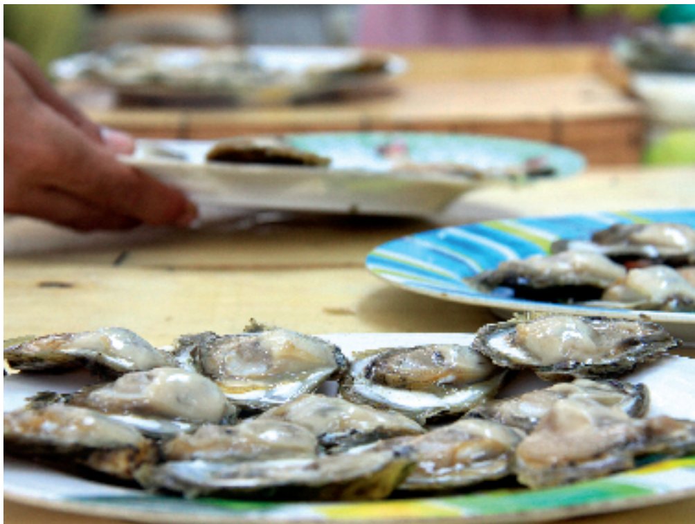
Venta de ostras en el Mercado de la Piedra. Vigo.