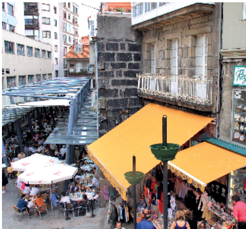
Mercado de la Piedra. Vigo.

La variedad del territorio gallego le otorga un atractivo turístico notable en el conjunto del país. En este sentido, el INE indica que durante el último año en Galicia se contabilizaron 7.789.513 pernoctaciones en hoteles (6.431.780 de residentes en España y