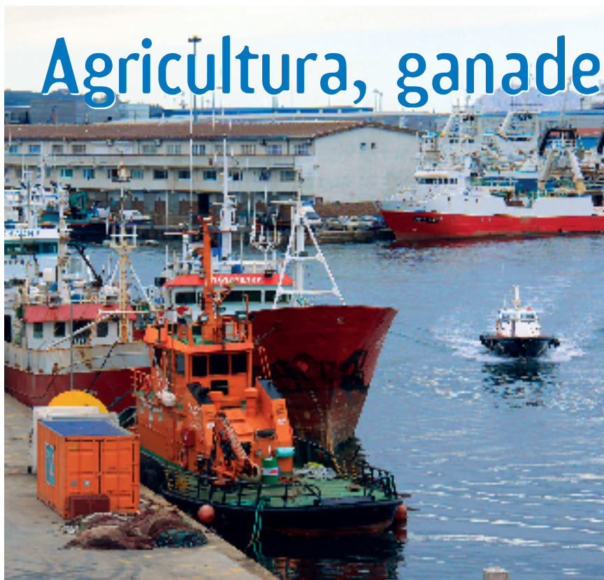
Puerto de Vigo.

G alicia es una comunidad histórica, formada por cuatro provincias y varios archipiélagos de pequeñas islas, que limita por el norte con el mar Cantábrico, por el sur con Portugal, por el oeste con el océano Atlántico y por el este con el Principado de Asturias y Castilla y León.