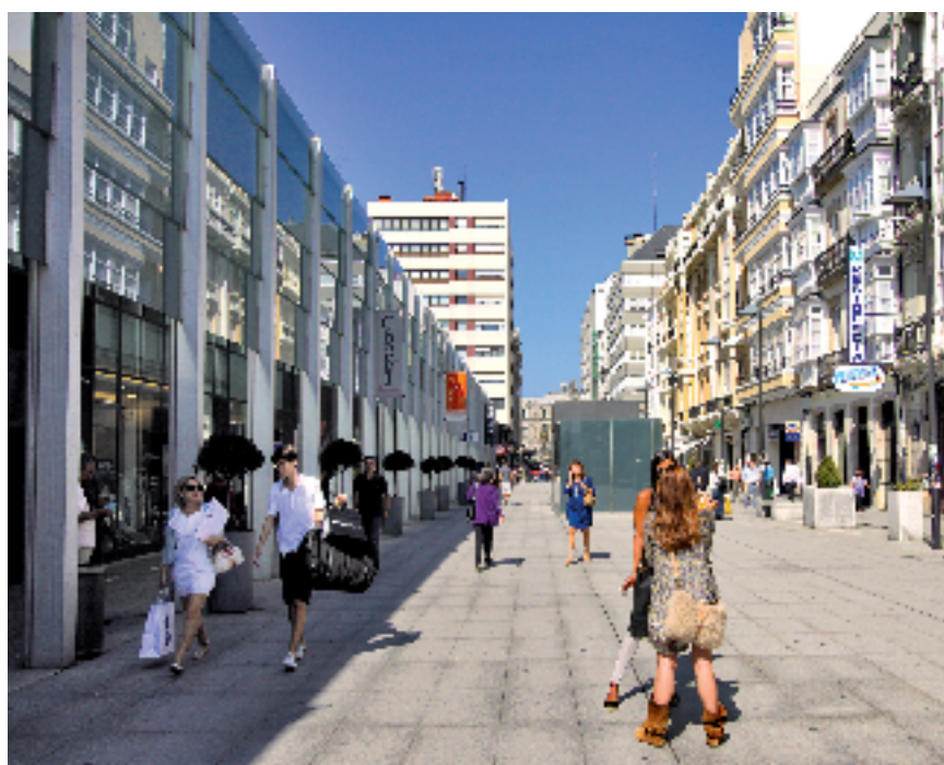
Plaza de Lugo. A Coruña.