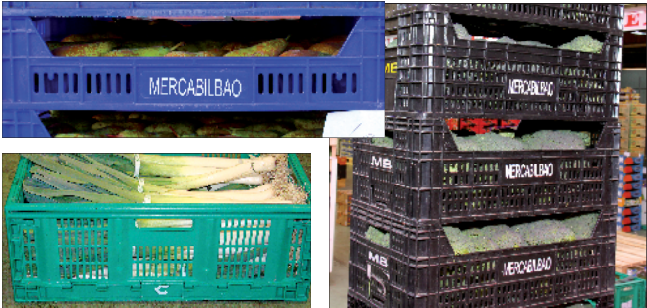
Tres modelos de cajas de plástico utilizadas en Mercabilbao.

gestor de sus envases, lo hacen mediante la constitución de una sociedad mercantil, Ibarreta 2000, S.A., en la que, independientemente del tamaño de las empresas de los socios fundadores, todos y cada uno de ellos suscribe el mismo número de acciones. Esto, que a simple vista no parece lógico por el diferente volumen de envases que mueve cada uno de ellos, cobra razón al señalar que es cada empresa mayorista quien asume inicialmente la fabricación del número de envases necesarios para su actividad, cediendo su uso a Ibarreta 2000.