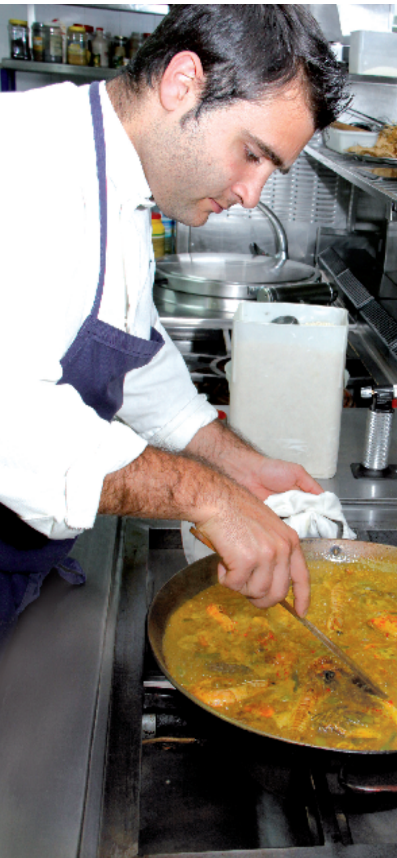
Restaurante Octivio's. Denia.