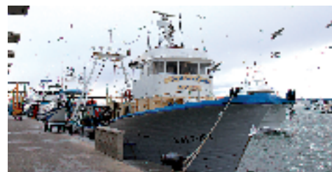
Puerto pesquero. Santa Pola.