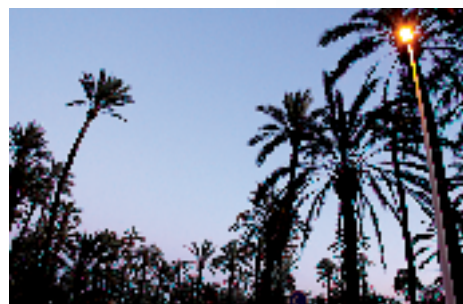
Palmeral de Elche.