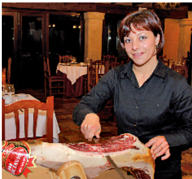
Restaurante Octavio's. Denia.

Final de etapa en alto, en Morella , corazón vivo de la comarca del Maestrazgo, tierra de frontera y de conflicto y lugar al que un día llegó el padre Vicente, San Vicente Ferrer, para realizar uno de los milagros más increíbles y surrealistas de la historia. Aquí hay que empezar volteando la muralla y el imponente castillo del siglo XIV, y dejar volar la imaginación por los vericuetos de sus callejas medievales. En el momento de abrir boca, un platillo de jamón y cecina, para dar paso al potente potaje morellano, las originales patates a la pell , a la carne mechada o metxa , el cabrit al forn , el cordero con trufa morellana o al levantisco potes i panxa , que es cosa parecida pero distinta a los callos. De postre y circunstancia, los típicos flaons o el pastel de calabaza.