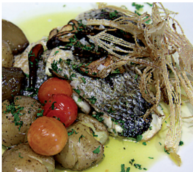
Lubina de anzuelo con patatas confitadas. Restaurante Octavio's. Denia.