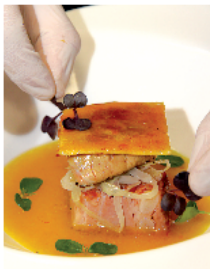
Restaurante Peñalén. Castellón.

La etapa por el ámbito de la provincia de Castellón sale de Borriana o Burriana, en la Plana Baixa, que luce hermoso casco histórico y un buen puñado de edificios modernistas y de estilo