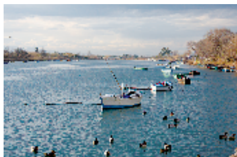
L'Estany de Cullera.