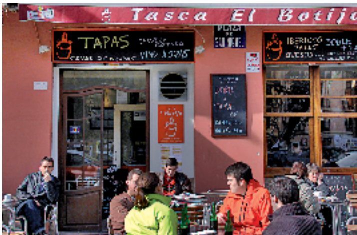
MIGUEL ÁNGEL ALMODÓVAR

Fin de trayecto en Utiel , que es la otra parte del nombre que compone el vino de la zona y que cuenta con un casco antiguo de diseño árabe y caserío cristiano medieval. A la mesa, habitas con calamares, morteruelo con tomate o lomo de ciervo con salsa de uvas. Para finalizar el ágape y para recordar en casa, dulcería antigua a base de arnadí y almojábanas.