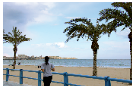
Playa del Postiguet. Valencia.