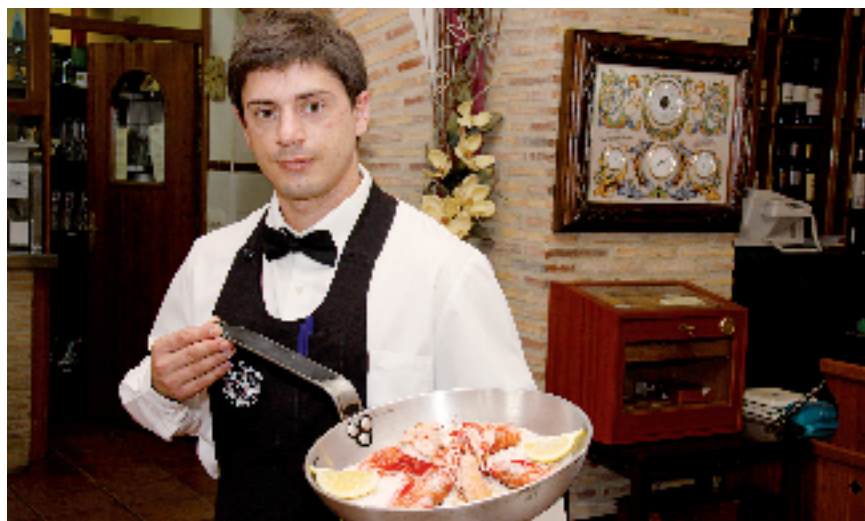
Casa Salvador. Cullera.

Siguiente parada en Alcoi o Alcoy, en la comarca de La Hoya, muy cerca de uno de los más hermosos ejemplos de bosque mediterráneo, y singular reservorio de platos tan típicos como la olleta de músic , la pericana , rica cosa de bacalao, pimientos secos, aceite y ajos, y el arroz con bacalao y coliflor. La meta, el pueblo del poeta del pueblo, Oriola u Orihuela y Miguel Hernández, respectivamente. Visita a la casa del poeta, a su huerto y a su higuera, al Museo Diocesano de Arte Sa-