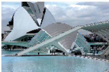
Ciudad de las Artes y las Ciencias. Valencia.