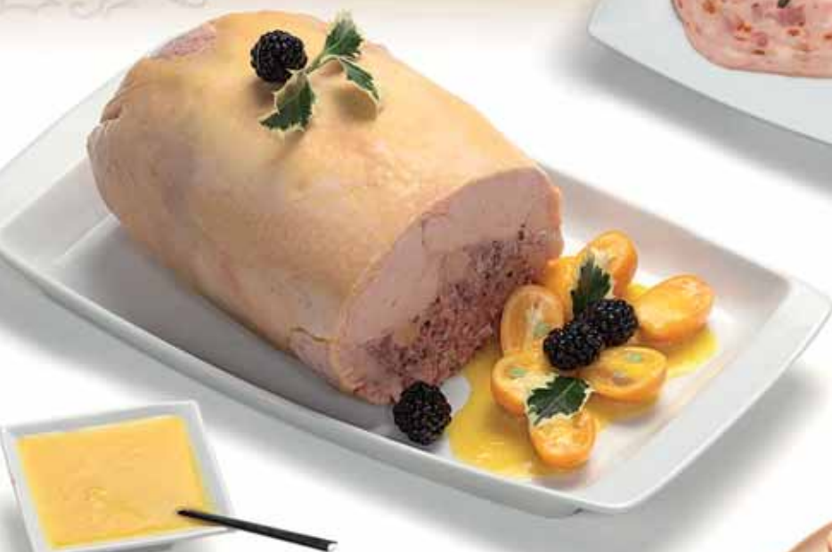
Capón deshuesado trufado con foie gras.