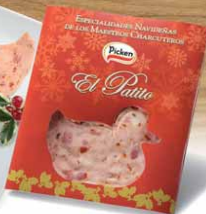
Silueta de patito