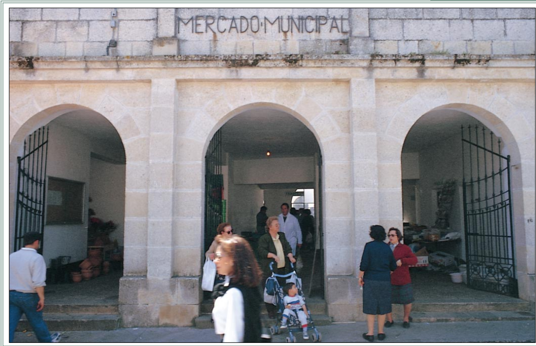
MERCADO DE TRUJILLO (CACERES)