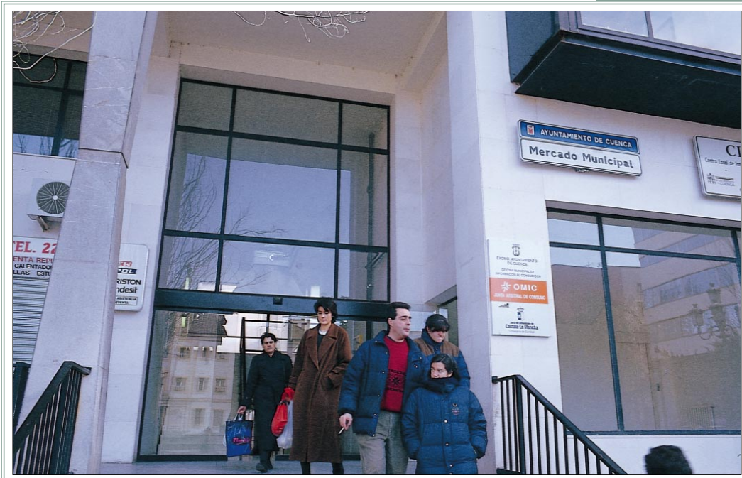
MERCADO MUNICIPAL DE CUENCA