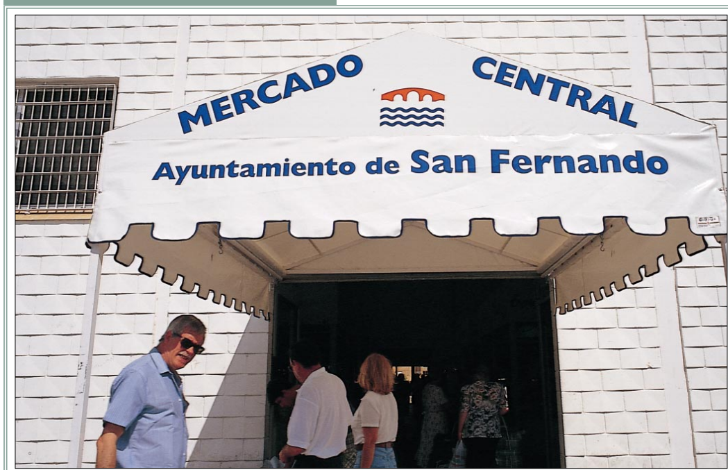
MERCADO CENTRAL DE SAN FERNANDO (CADIZ)