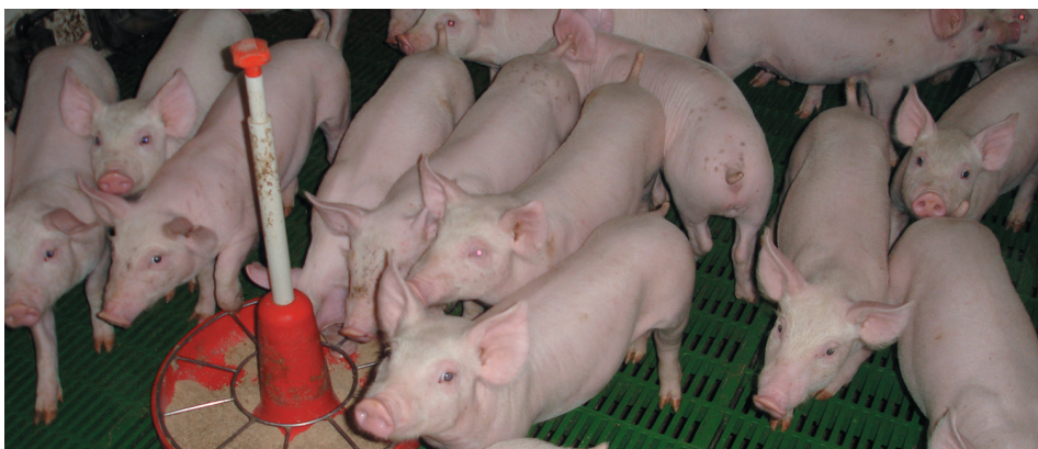
Alojamiento de transición.