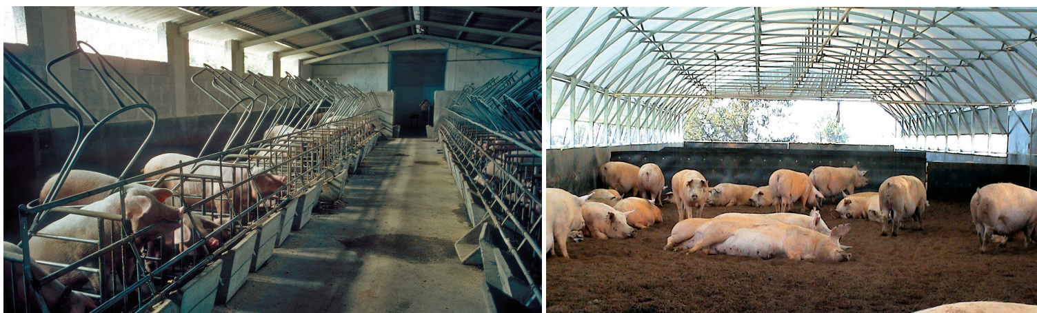
Sistemas de alojamiento de cerdas en grupo.