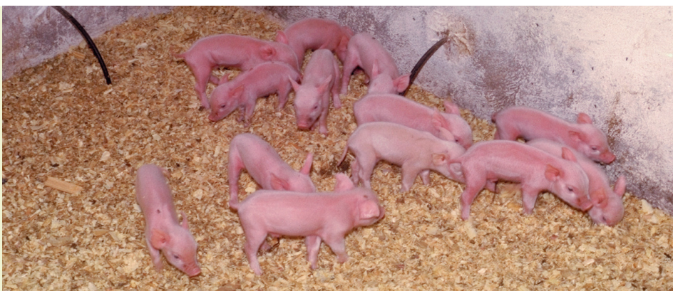
Arriba: Alojamiento en serraduras. A la izquierda: Corrales de transición.

La dimensión de cada corral de transición debería ser tal que a los 30 kg de peso vivo se dispusiera de 0,30 m 2 de superficie por animal, o sea, por 100 lechones el corral debería haber 30 m 2