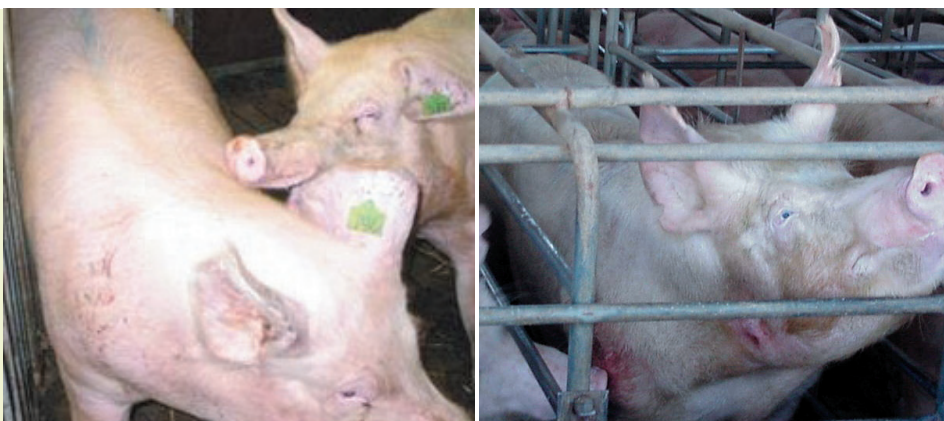
Ejemplos de estrés social en grupos y jaulas.

Hay que acercarse a los animales con la máxima calma posible, porque el estrés “se contagia” entre los animales y las personas