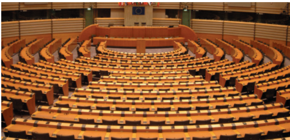
Sede del Parlamento europeo (Bruselas).