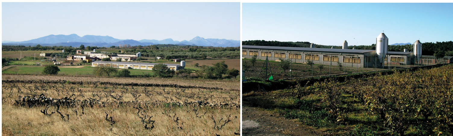
Explotaciones porcinas.