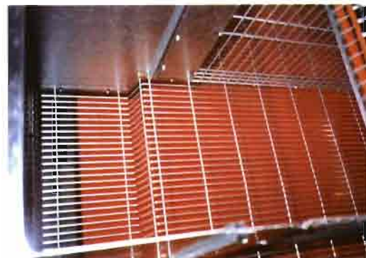
Detalle del interior de la jaula Sprint con las ranuras metálicas para el separador y el piso en forma de 4 para ubicar el nidal bañera

* El conjunto JAULAS SPRINT-10, polivalentes, que se convierten en JH o JE mediante un separador de fácil manipulación. Disponen de alimentación automática por bisenfin.