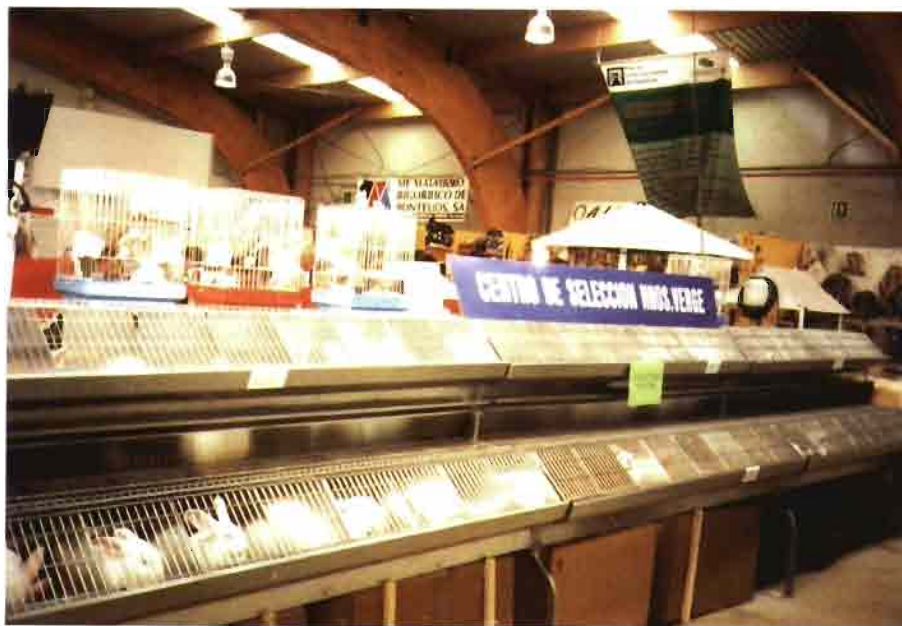
Conejos a la venta de Hnos. Verge