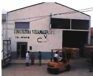
■ Almacén y local social

INVOLUCRAR AL SOCIO, EXCLUSIVIDAD E INDEPENDENCIA, LAS CLAVES DEL ÉXITO