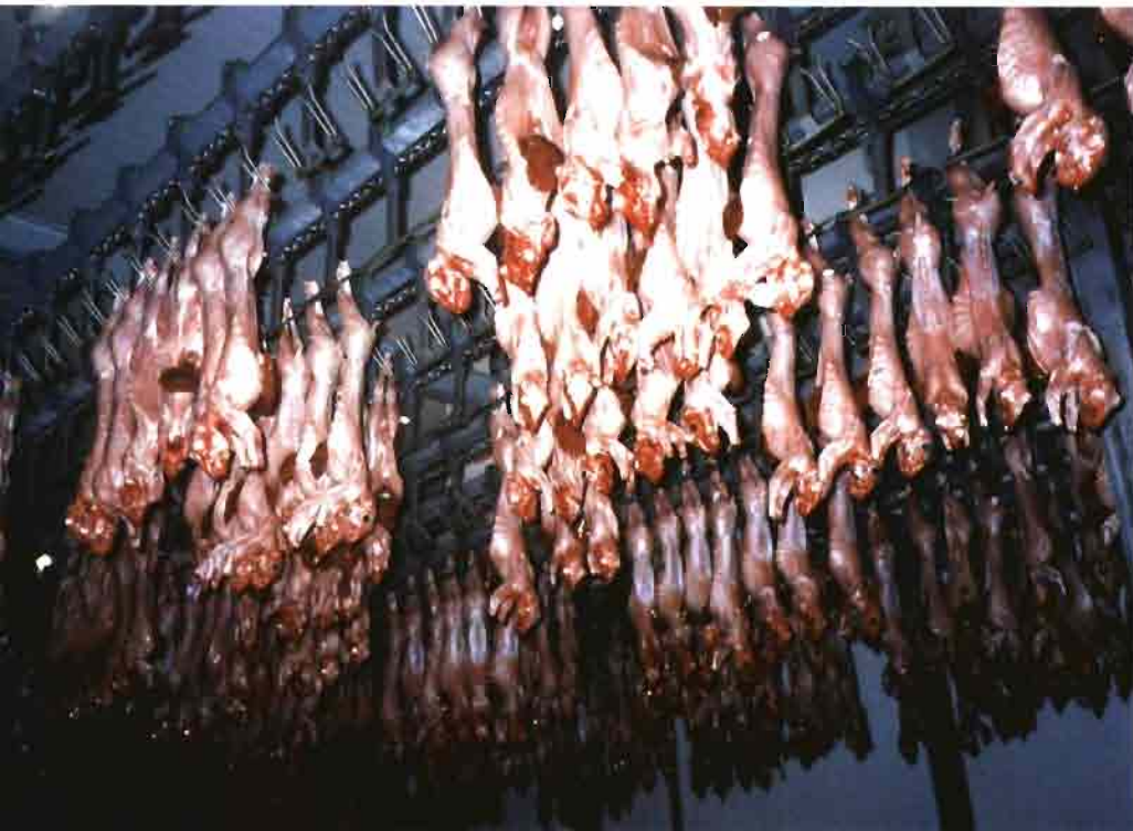
■ Cámara de oreo del matadero de Cunicultura Villamalea

que, conjuntamente, representan 32.000 conejas.