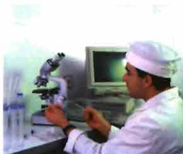
■ Los socios disponen de un centro de I.A.

El éxito de nuestra Cooperativa ha sido, en primer lugar los socios y, en segundo, aunque no por ello menos importante, una plantilla fija de 25 trabajadores que se han involucrado en el proyecto. Estos dos pilares son nuestro principal acti-