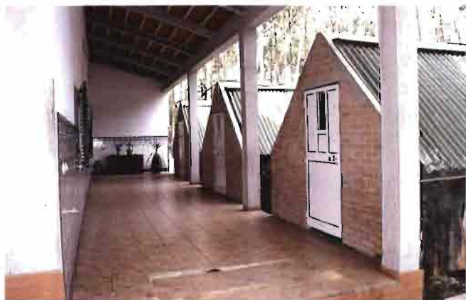
Impresionante vista de los Open Air, servidos directamente desde el edificio central.