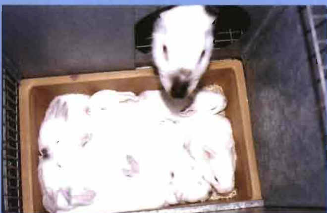
■ Nidal, con el sistema de poderse quitar, y el hueco queda cubierto mediante la pieza relax.