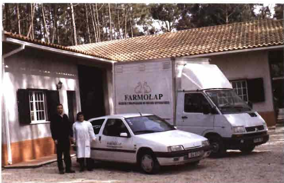
El matrimonio Costa en la entrada de la granja de Selección.

Son en total 1.256 jaulas, repartidas de forma original por su tipo de manejo y producciones, 280 jaulas maternidad, 30 para machos, 250 para engorde sobrantes, y 696 jaulas para selección, reposición y gestantes.