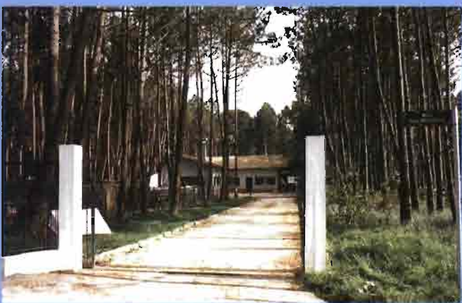
■ Ambiente sano, bosque situado relativamente cerca del oceano Atlántico.

Los fosos son de tipo semiprofundo. El estiércol va buscado al ser de buen resultado en los cultivos intentivos de la zona, a cuyos hortelanos se les ofrece gratuitamente a cambio de la mano de obra para su extracción, que hacen frecuentemente.