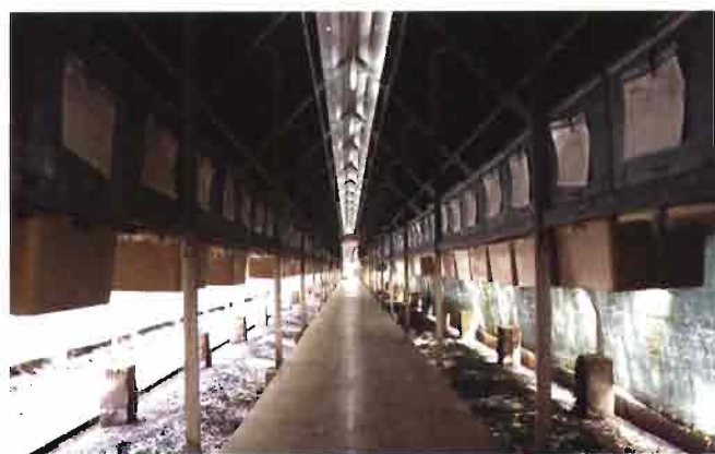
Interior del Open Air, con jaulas Extrona, para demostrar los detalles de sustentación, y del pasillo de gres.