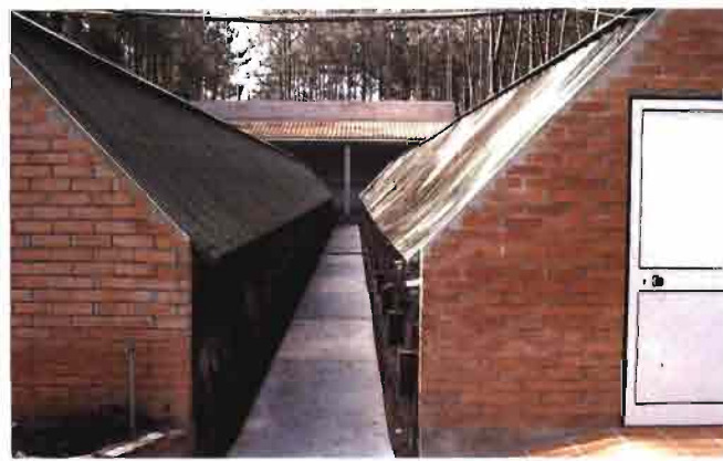
Pasillo de limpieza entre Open Air.