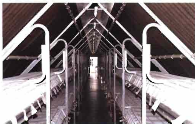
Gran cantidad de Jaula Italona de Extrona al dedicarse a selección de diversas líneas.