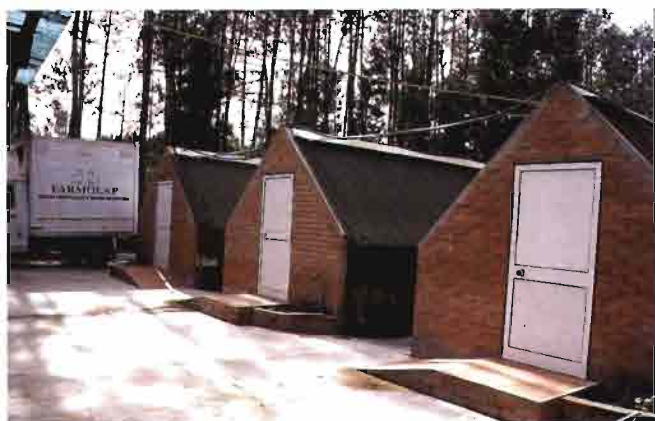
Cabecera de las tres naves Open Air, con su perfecto acabado.