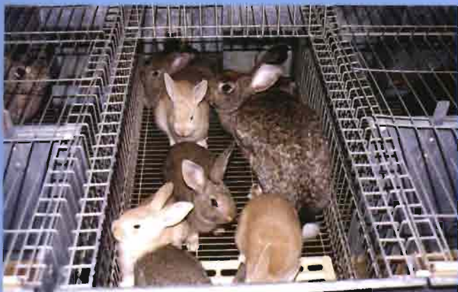
■ Madre con su camada, de una línea maternal. Las jaulas, Ecus, individuales, han sido escogidas por ser de quita y pon y por poder desinfectarse a fondo.