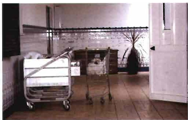
La otra cabecera de las naves se abre a un zagnán con bellos azulejos portugueses. La puerta blanca corresponde a una de las naves.