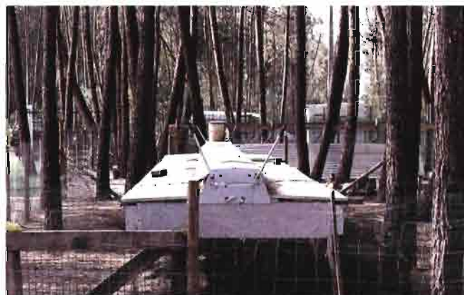
Debajo altos pinos, parte de la línea Gord-Air de Extrona, para engorde de los gazapos excedentes y sobrantes de selección. Plena naturaleza.