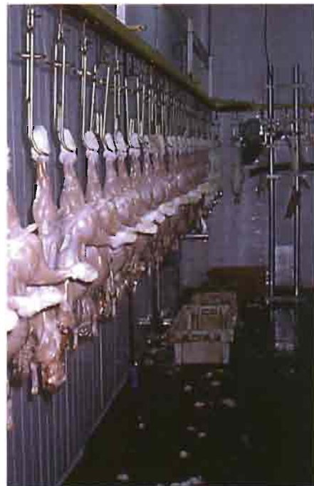
En el matadero Alto Jiloca la línea de sacrificio posee una capacidad para 600 conejos a la hora.