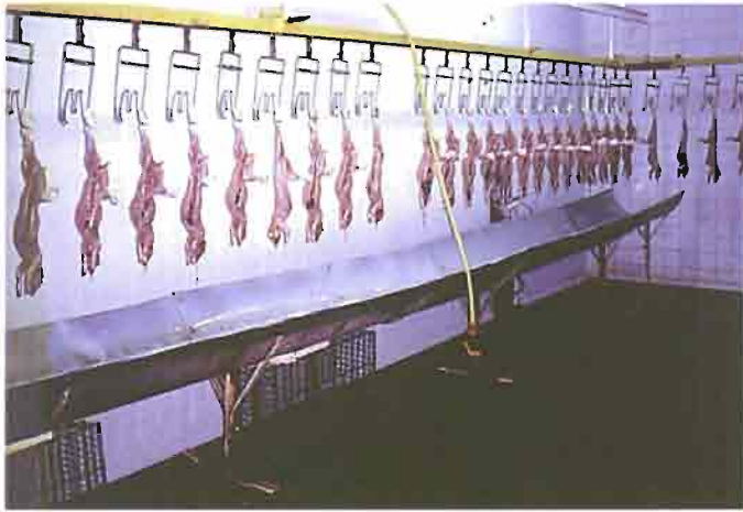
Sala de evisceración en el matadero Alta Jiloca.