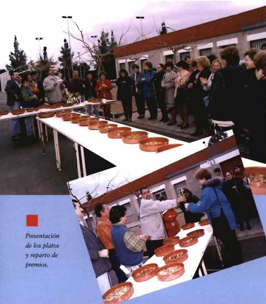
Presentación de los platos y reparto de premios.