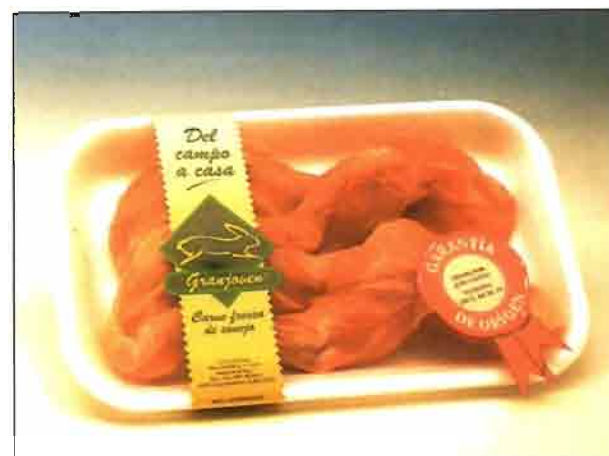
Paletillas de conejo (REF. 0607) Bandeja de 250 a 300 gramos. Carne deliciosa y sana, dietética y baja en colesterol.