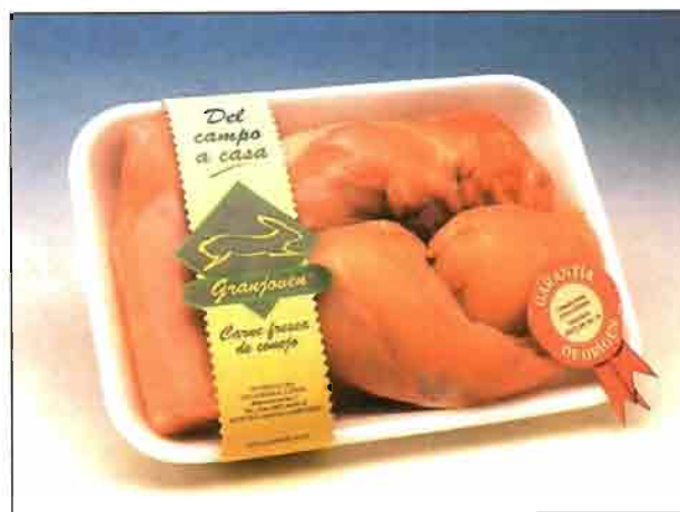
Conejo entero troceado (REF. 0600) Bandeja de 900 a 1.200 gramos. Carne deliciosa y sana, dietética y baja en colesterol.