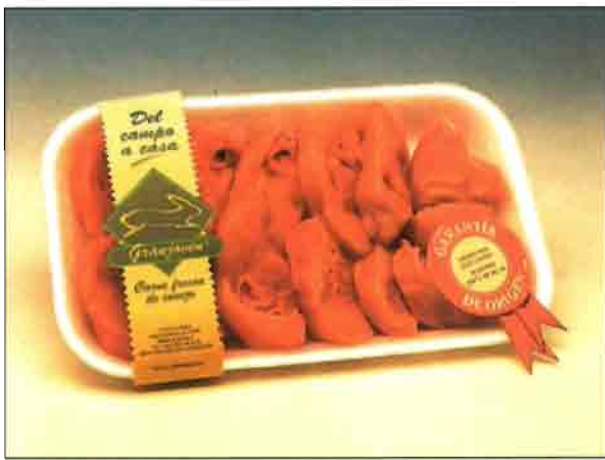
Piernas troceadas de conejo (REF. 0606) Bandeja de 300 a 400 gramos. Carne deliciosa y sana, dietética y baja en colesterol.