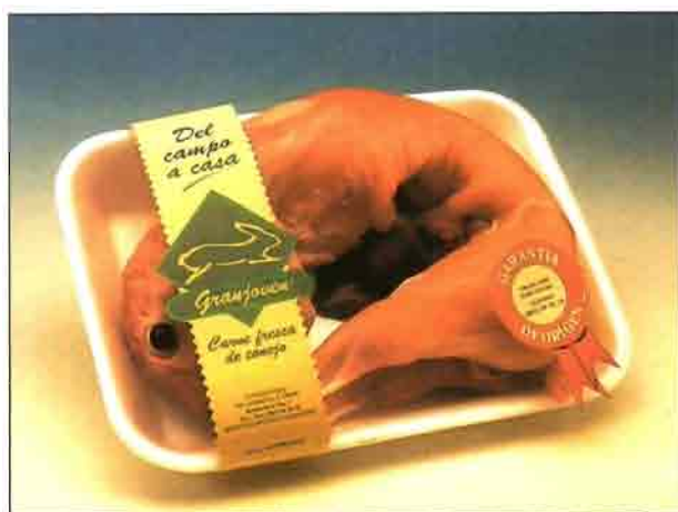
Conejo entero (REF. 0601) Bandeja de 1.000 a 1.200 gramos. Carne deliciosa y sana, dietética y baja en colesterol.