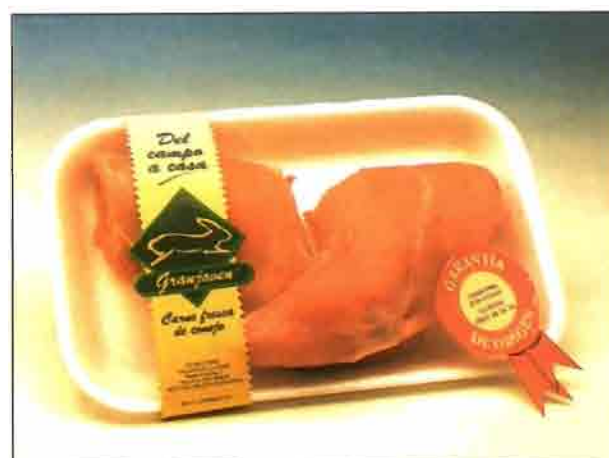
Piernas enteras de conejo (REF. 0605) Bandeja de 350 a 400 gramos. Carne deliciosa y sana, dietética y baja en colesterol.