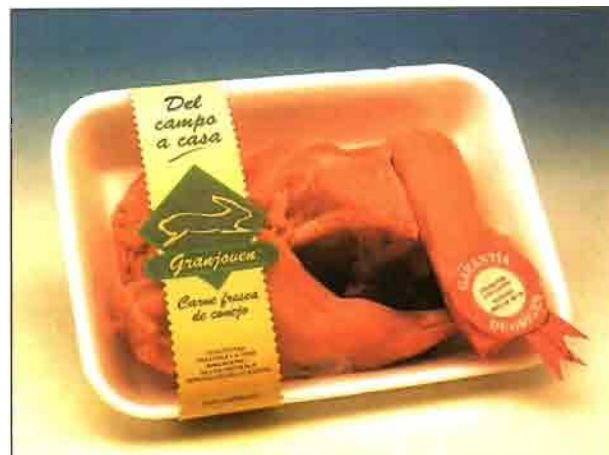
Medio conejo troceado (REF. 0602) Bandeja de 500 a 600 gramos. Carne deliciosa y sana, dietética y baja en colesterol.