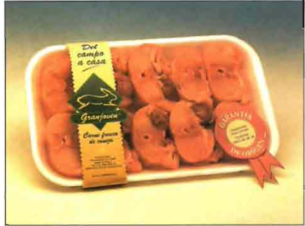
Medallones de lomo de conejo (REF. 0604) Bandeja de 350 a 450 gramos. Carne deliciosa y sana, dietética y baja en colesterol.