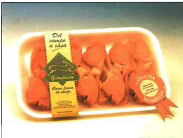
Chuletillas de conejo (REF. 0608) Bandeja de 250 a 350 gramos. Carne deliciosa y sana, dietética y baja en colesterol.