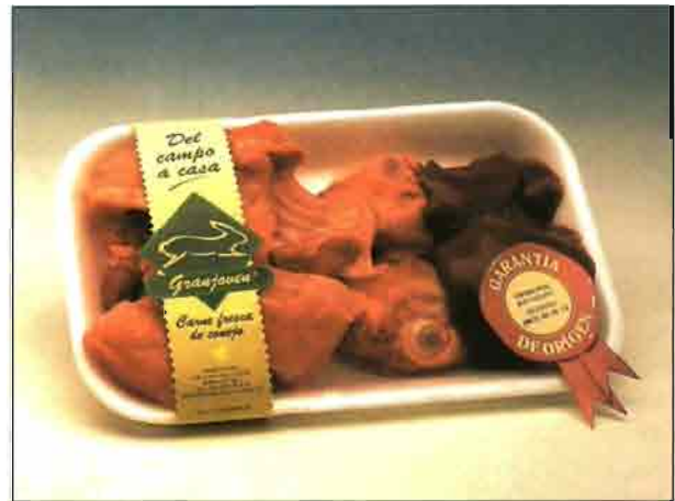
Preparado de paella (REF. 0603) Bandeja de 300 a 400 gramos. Carne deliciosa y sana, dietética y baja en colesterol.