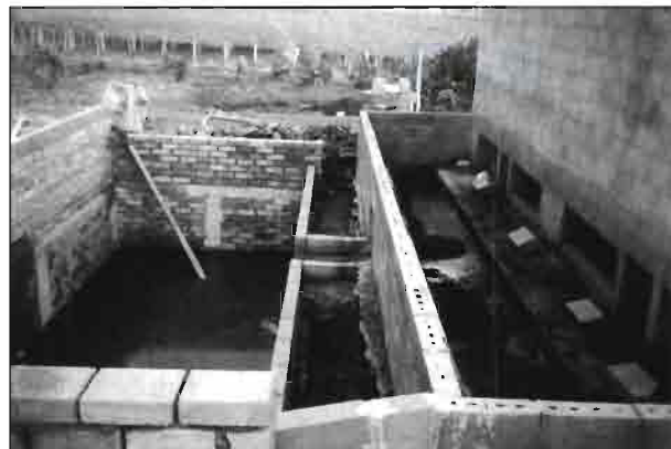
Fosa de decantación y estocaje de purines.

Si bien es cierto que a instalaciones ganaderas mayores, menor es el problema del impacto sobre el medio, ya que se concentra, en un solo punto de emisión, la contaminación. Pero tampoco deja de ser cierto que su afección sobre el medio es mayor por el volumen de deyecciones que se producen a tenor del mayor número de animales. Aunque