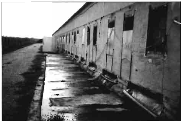
Evacuación directa al exterior por cinta transportadora.

parezca un contrasentido es preferible tener en un solo punto la producción de animales que no que estén dispersos por todo el territorio. De esta manera se puede industrializar la gestión de las deyecciones ganaderas y minimizar su impacto sobre el medio.