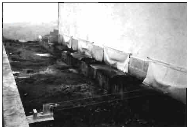
Sistema de salida de las palas mecánicas.

Morales, G. y Prats, I. L. (1.995) La legislación sobre residuos ganaderos. Su análisis. Cap. XVIII. Zootecnia.