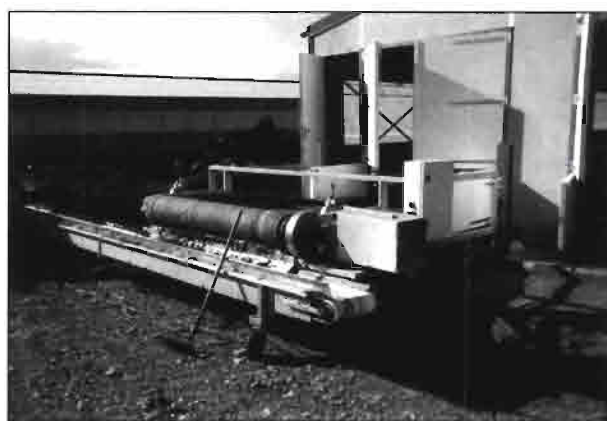
Sistema de descarga de las cintas a una cinta transversal.

En lo referente al manejo hay que tener en cuenta el tiempo que debe dedicarse a esta operación. Este tiempo (coste de producción directo en la explotación que debe