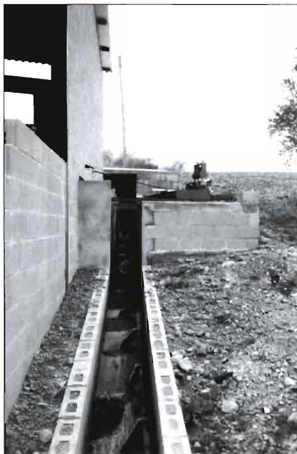
Palas de arrastre transversales.

Bases de producción animal. Tomo IV. Ediciones Mundi-Prensa Madrid