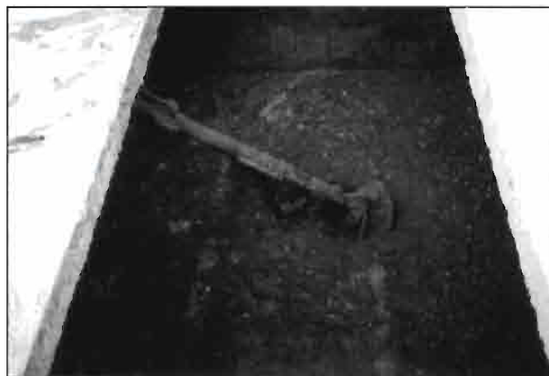
Pala removedora para la captación del estiércol a una cuba.

La producción de estiércol sólido o de purín depende del sistema de evacuación utilizado en la granja cunícola. Mayoritariamente el estiércol se retira en forma sólida. Aunque esta forma de manejo sea la más utilizada. Seguidamente, en la tabla 3, hacemos referencia a los sistemas de evacuación que disponen las instalaciones de producción de conejo.