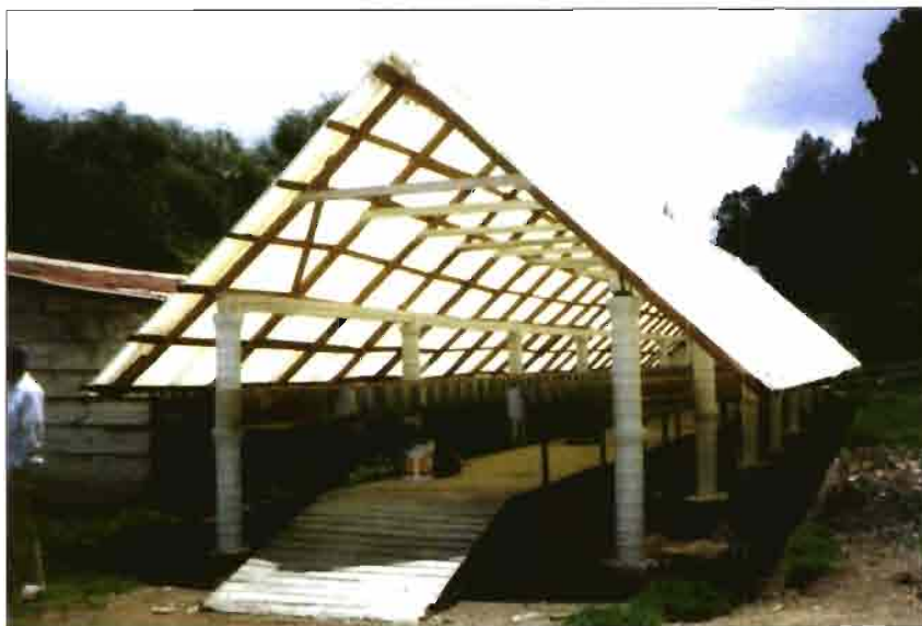
Instalación aire libre en México, con cubierta de fibra de vidrio y soporte de madera.

En cualquier caso, el sistema de jaulas «aire libre» no vienen contempladas en las normativas urbanísticas