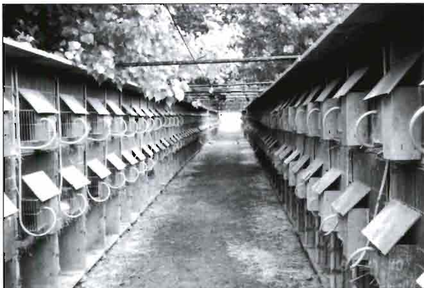
Sistema aire libre sombreado con árboles. Granja LA SENIA (Tarragona).

son compatibles con el ambiente circundante.