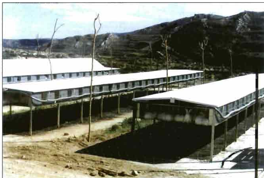
Jaulas aire libre sin cubierta de obra, con aislamiento propuesta por ALIAS.

No se han hallado diferencias significativas