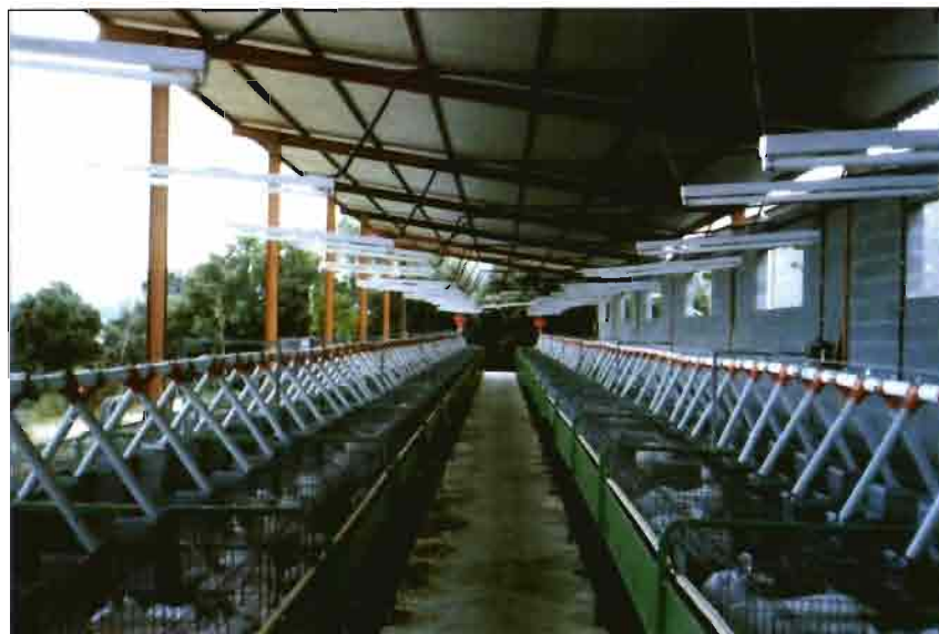
El aire libre no está reñido con la mecanización.