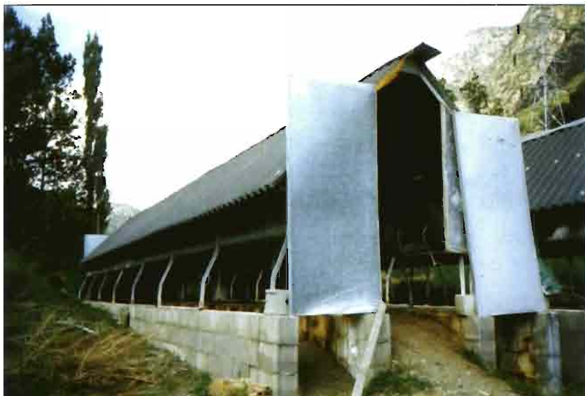
Sistema de instalación "OPEN AIR", sobre pilares y muretes de hormigón. Es económico y fácil de instalar.

la evolución de las estructuras de los conejares, alojamientos y jaulas, ha representado más que un adecuamiento a las necesidades de la especie, casi una imposición al animal, hasta el punto de que se ha pensado que sería ya el momento de adecuarse a las tipologías de alojamiento propuestas. Esta situación del momento o de la estrategia y desarrollo de las técnicas de crianza, selección, alimentación ha desbordado las posibilidades de innovación por la innovación. Con el paso del tiempo, algunos sistemas han sido abandonados, bien porque eran poco adecuados, o porque han sido superados por otras ideas más innovadoras y especulativas. Permanece, eso sí, el reto constante de los cunicultores por adaptarse constantemente a situaciones del mercado y a hechos relacionados con la propia fisiología de la especie. En relación al tiempo, y en el cuadro de las estrategias propuestas, con objeto de perseguir el objetivo de la rentabilidad, queremos señalar todas las sugerencias que intentar salirse del sistema tradicional, no siempre pueden ser recibidos como verdaderas innovaciones.