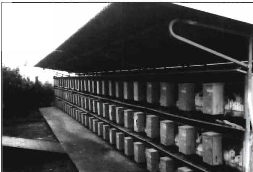
Batería al aire libre bajo un cubierto simple.

o higio-sanitarias que rigen las instalaciones para animales. Esta situación representa un arma de doble filo, por cuanto por un lado puede favorecer al cunicultor en la carencia de burocracia, pero por otra deja en manos del ente local para la aprobación de los proyectos o sus ampliaciones. Los motivos que podrían abrir un contencioso pueden deberse a las siguientes consideraciones: