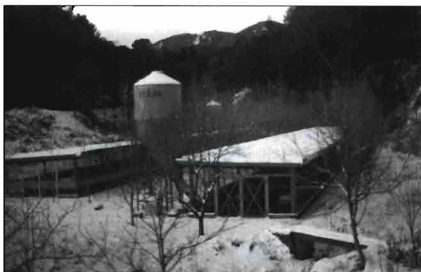
La nieve no es obstáculo para criar conejos al aire libre. (Granja RIUDEMEIA, Argentina).