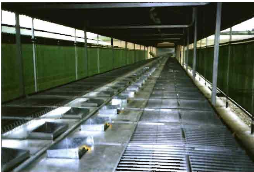
Sistema aire libre ligero con protección lateral propuesto por COPELE.

Entonces cabe considerar que en la cría intensiva el ambiente juega un papel muy importante para influir en la patología -por ejemplo respiratoria o digestiva-, causada por agentes bacterianos o víricos. Para la idoneidad ambiental es necesario estudiar una correcta interacción entre los parámetros anteriormente citados con el fin de obtener un buen ambiente en las explotaciones; en cierta forma, si las condiciones ambientales no son las adecuadas, los mecanismos de defensa de los animales disminuyen y se favorece la aparición de enfermedades. La bibliografía sobre este he-