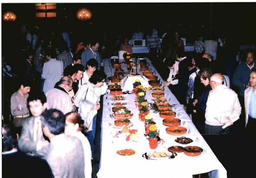
Magnífico aspecto de la Mesa en que se presentaron los 44 platos de conejo por cocineros aficionados.

Con motivo de las Fiestas de la «Santa Creu» de la capital del Alt Empordà, se celebró un concurridísimo concurso gastronómico, insertado ya plenamente en el marco de las fiestas tradicionales de Figueres. La presentación de este concurso, con importantes premios y trofeos, lo organiza tradicionalmente la Associació de Cunicultors del Alt Empordà , gracias a la diligencia y dinamismo de su junta directiva, tiene la originalidad de que se trata de un certamen dirigido a amas de casa y no profesionales de la restauración. Destacamos además que 18 restaurantes de Figueres, ofrecieron estos días una selección gastronómica basada en el conejo.