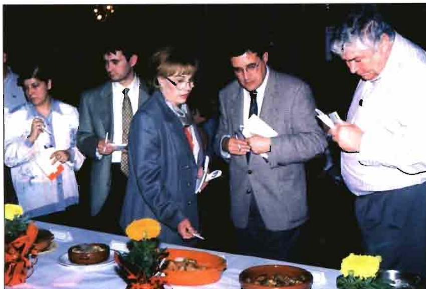
Difícil deliberación del jurado ante la cantidad y variedad de recetas.