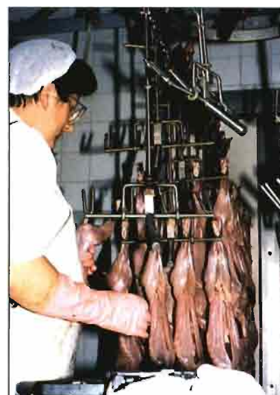
Saliendo del túnel de oreo, las canales refrigeradas son seleccionadas por su tamaño y peso.