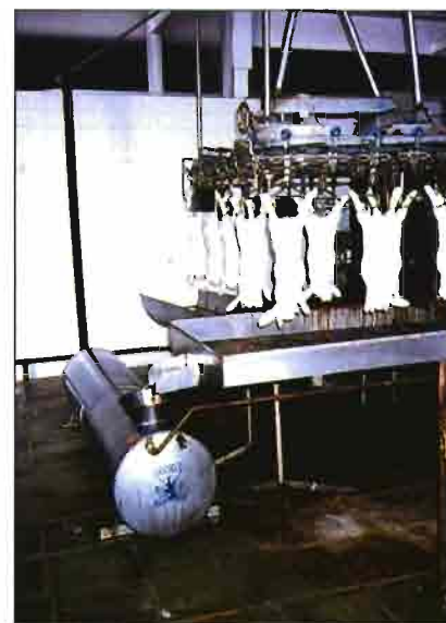
La sangre es recogida en un tanque adecuado, vaciándose por bombeo.