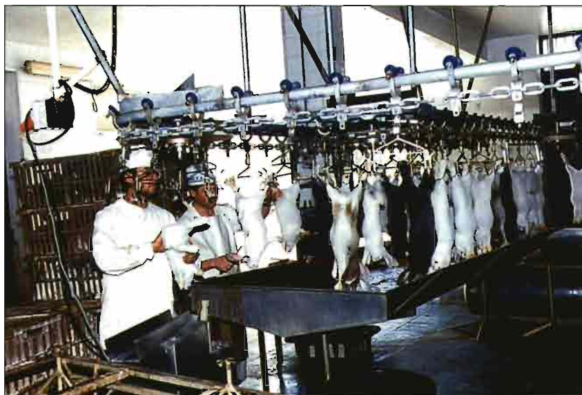
La matanza está situada junto al arca de descanso y muelle de recepción del ganado. En este punto se inicia el trabajo en cadena.