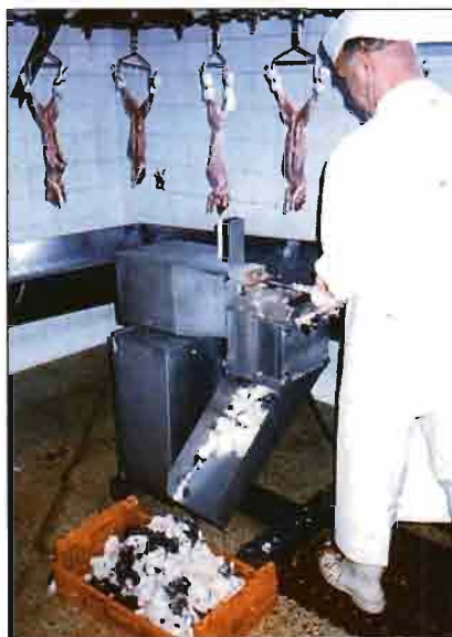
Tras la evisceración se efectúa el repelado mecánico de las patas y clasificación de los animales.

La tercera área recibe los conejos despellejados, procediéndose al eviscerado manual, repelado mecánico de las patas, refinado y clasificación de las canales. Las vísceras pasan a una canal que las traslada a un tanque digestor situado en el exterior. Al finalizar estas operaciones, el conejo pasa a ser carne cambiándose de la cadena inicial a otra, momento en el que se fija el marchamo sanitario. La nueva cadena introduce inmediatamente las canales en el túnel de refrigeración y oreo. Antes del cambio de cadena las canales son