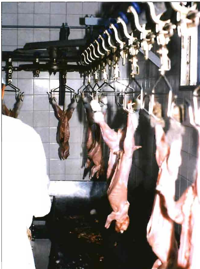
Después del desollado, se procede a la evisceración de los conejos, operación que se efectúa en un área especial.