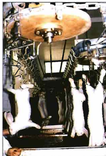
Detalle del canal de matanza y desangrado de los conejos. La instalación tiene una capacidad para 1.200 gazapos hora.