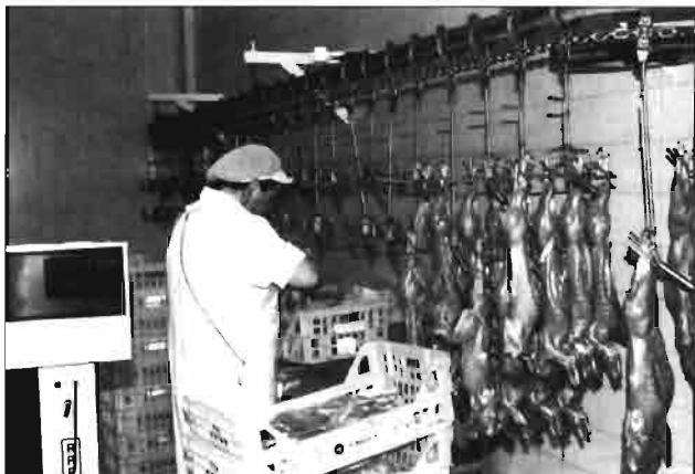
A la salida del túnel se preparan las cajas de 10 canales, con pesos normales (10,5-12 Kg.) o ligeros (9,0-10,5 Kg.).