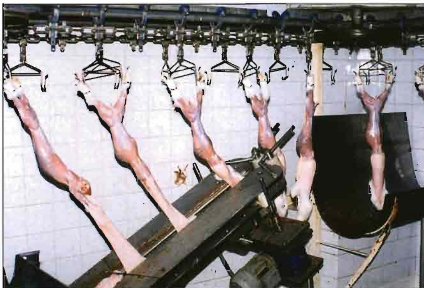
Máquina de despellejar conejos en plena faena. Equipo de reciente instalación que se complementará con una cinta transportadora de pieles.