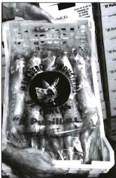
Presentación de 10 canales en bandeja de plástico. También se utilizan cajas de cartón.

El equipo de redacción del «Boletín de CUNICULTURA» agradece las atenciones recibidas por el equipo directivo del matadero y desea significar que el reportaje no se limitó a la toma de datos y referencias, lo cual muestra la profesionalidad y servicio de «El Pubill, S.L.».