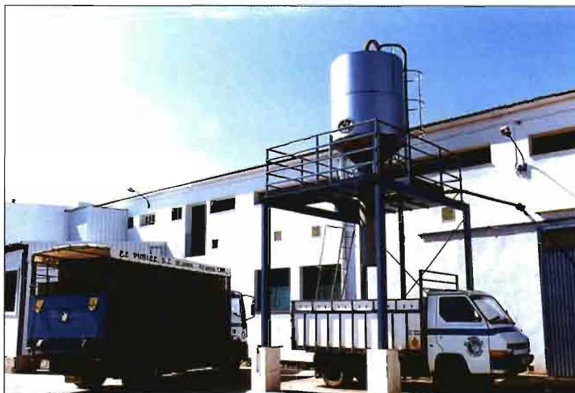
Vista de la zona de acceso de los gazapos y del tanque digestor al que se vierten sangre y vísceras abdominales. El matadero dispone de una flota de cinco camiones.