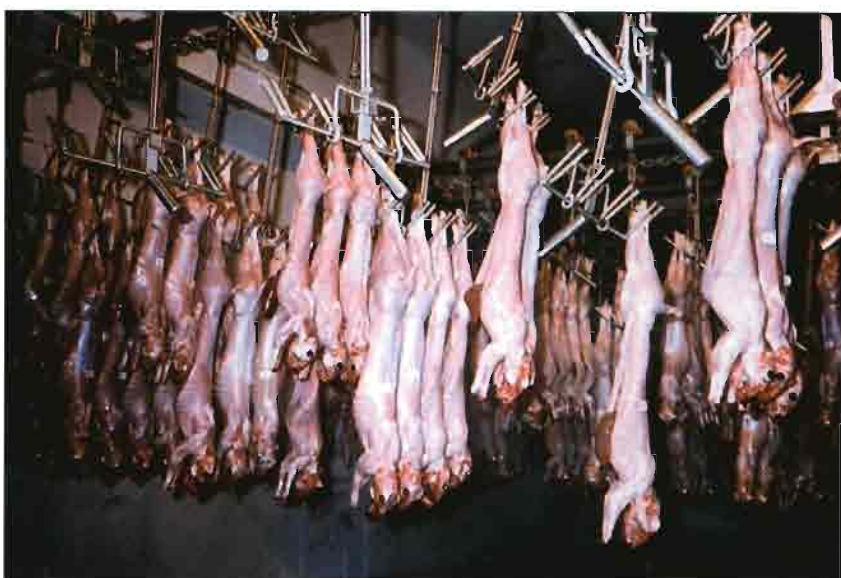
Vista del interior del túnel de oreo, en el cual las canales son refrigeradas y acondicionadas.