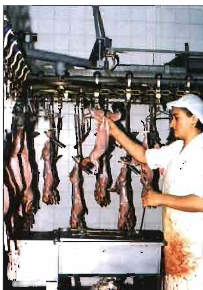
Una vez finalizada la limpieza de patas, las canales se cambian de cadena, paso previo a la entrada al túnel de oreo.

El producto cárnico debe responder a las más estrictas normas de calidad, lo que garantiza la inspección veterinaria, la cual realiza decomisos que suelen situarse alrededor del 1 % de las entradas. El servicio de inspección no sólo cuida de los aspectos sanitarios, sino que a raíz de los hallazgos patológicos advierte a los cunicultores que suministran los conejos sobre posibles problemas en sus granjas. Entre las lesiones que causan más descualificaciones figuran los abscesos de diverso tipo y lesiones por larvas migratorias de cisticercos en hígado. Debido a que la procedencia mayoritaria de los conejos es de granjas industriales, la presencia de lesiones de coccidiosis hepática es prácticamente nula.