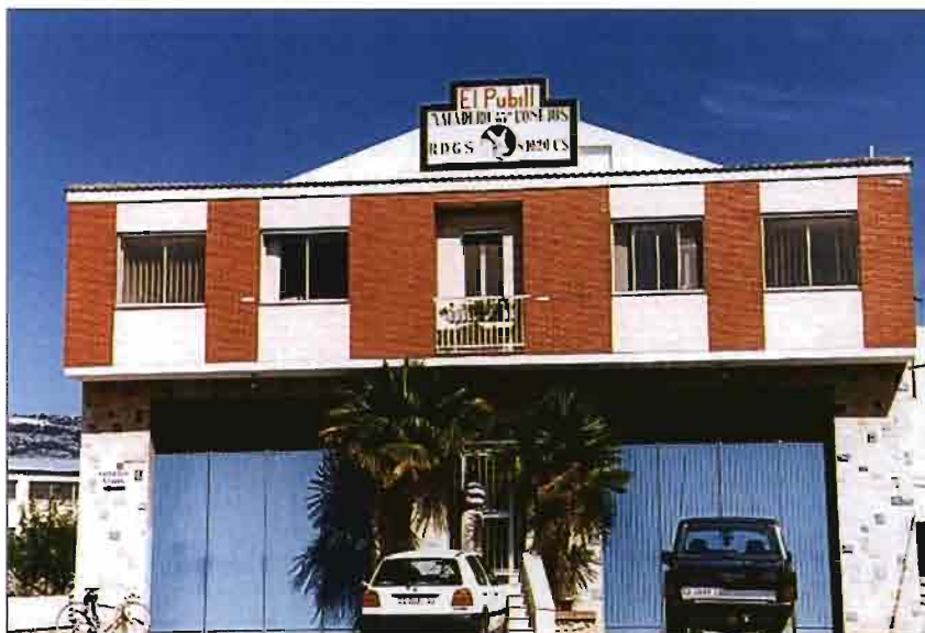
Fachada principal del matadero, en el que está adosado el muelle de carga de las canales de conejo en los transportes frigoríficos.

La población de Catí, está situada en una zona montañosa, cerca del acceso a los puertos de Morella, junto las sierras del Maestrazgo - Vallivana, Nevera y Barbuda-. La ciudad cuenta con 960 habitantes y es de origen islámico; conserva un