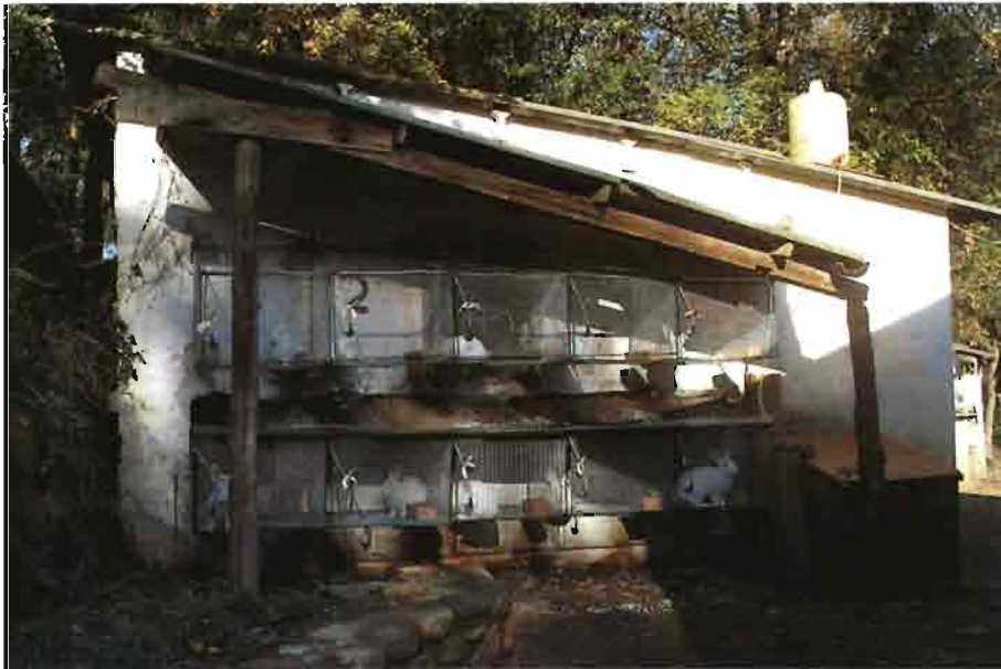
Los conejares tradicionales no siempre significan bienestar y trato adecuado de los animales

A partir de su interés puramente zootécnico, la formulación alimenticia juega un papel determinante en el equilibrio de la flora intestinal: los ácidos grasos volátiles, nacidos directamente del metabolismo de los glúcidos, ejercen un papel inhibitor sobre los colibacilos patógenos principales responsables en las enteritis a menudo mortales en el conejo.