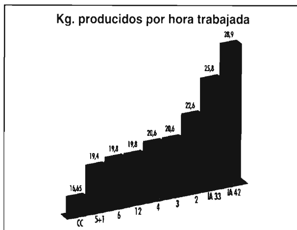
Fig 3.- Kg. producidos por hora trabajada en granja, en los distintos sistemas de manejo.

Un factor a considerar en las explotaciones cunícolas es el costo de la mano de obra, por lo que es un factor más a considerar y tener en cuenta para el costo por Kg producido. En general puede considerarse que la productividad horaria aumenta a medida que disminuyen el número de bandas por una parte, y el número de traslados de animales por otra. Cabe considerar que en este cálculo se tiene en cuenta el tiempo de trabajo total pero no su distribución, ni de posibles «puntas» eventuales.