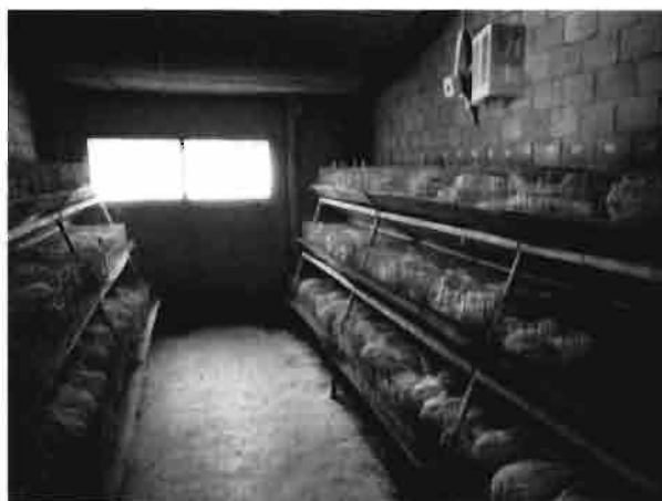
En verano es importante proveer una buena aireación y reducir la temperatura. No está de más disponer de elementos reguladores.

En las hembras se produce reducción de la producción de leche, reducción de la fertilidad, reducción de la vitalidad de los gazapos nacidos y aumento de la mortalidad embrionaria.