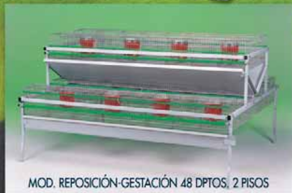
MOD. REPOSICIÓN-GESTACIÓN 48 DPTOS, 2 PISOS