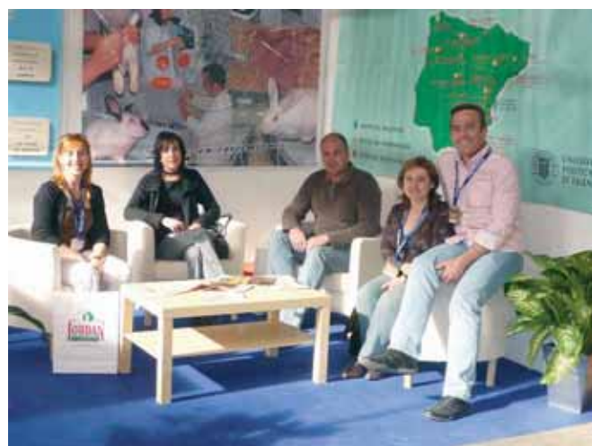
Stand de Granja Jordan