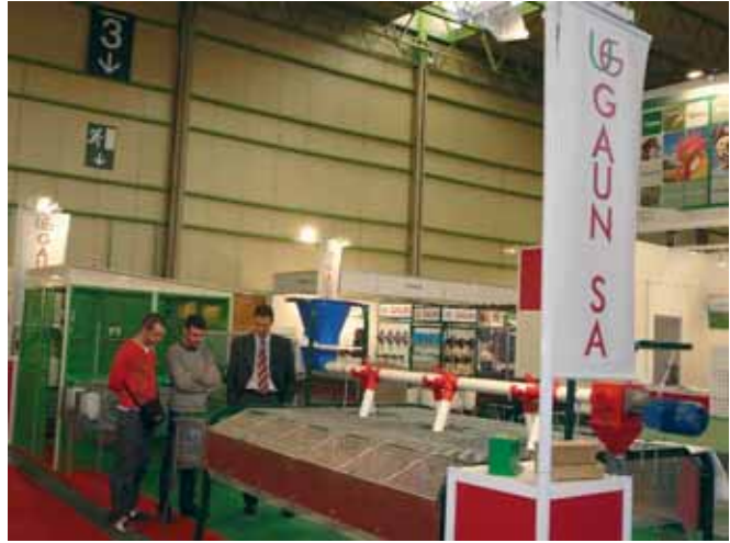
Stand de Gaun