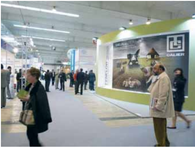
Stand de Calier