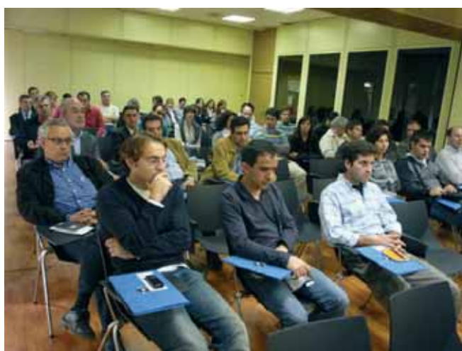
Jornada sobre El uso racional y prudente de antimicrobianos en cunicultura