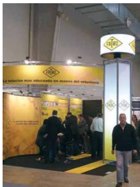
Stand de Fatro