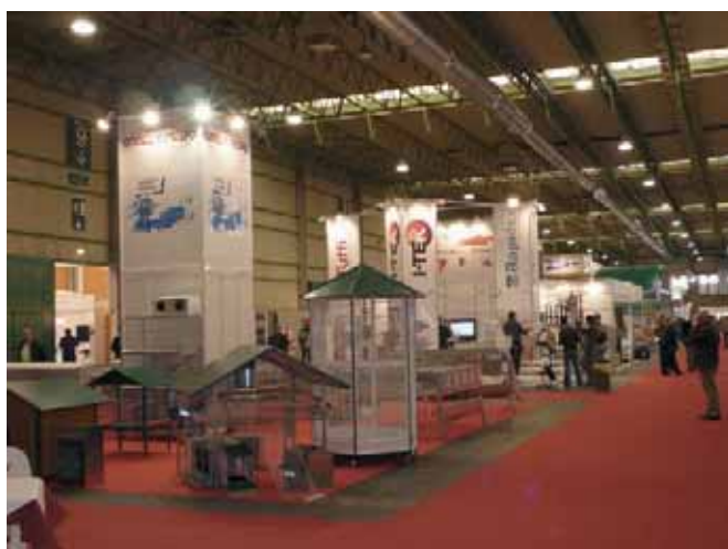
Stand de Gómez y Crespo