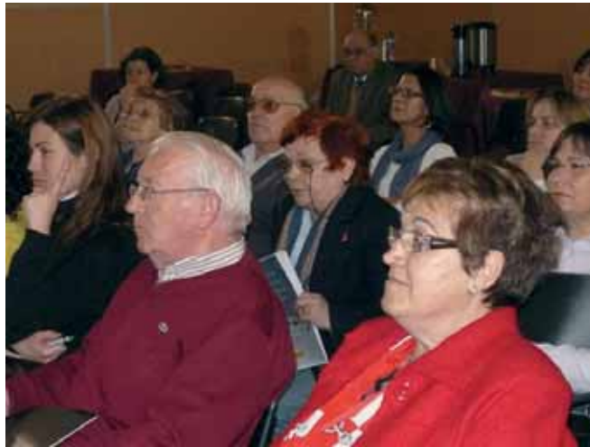
Jornada sobre Cualidades saludables y gastronómicas de la carne de conejo