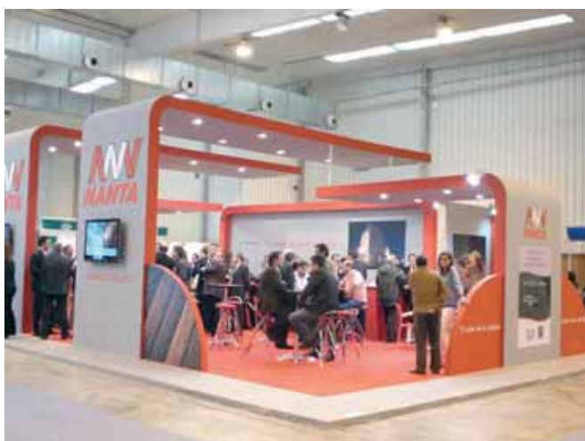
Stand de Nanta