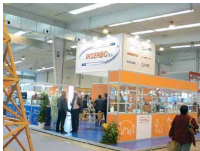
Stand de Inserbo