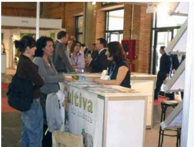
FIGAN contó con la presencia de más de 50.000 visitantes