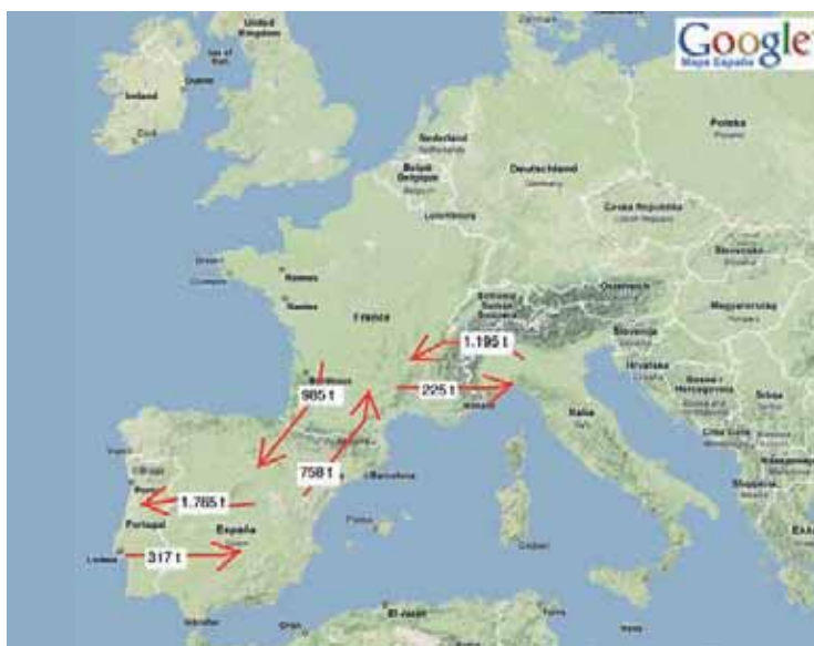
Tabla 1: Comercio Exterior de Carne de Conejo*

El comercio exterior de carne de conejo supuso, en 2008, la venta fuera de nuestras fronteras de 3.552 toneladas, aproximadamente 70 toneladas mensuales, lo que representó un 5,17 % de la producción total. Como no podía ser de otro modo, también fue un año malo para las exportaciones ya que se exportó un 17% menos producto que en el año 2007, y fue el periodo en el que se vendió menos carne al exterior desde el año