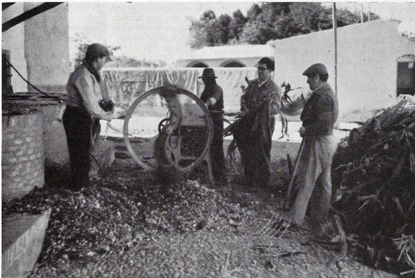
Un buen ensilado del maíz forrajero requiere un previo picado, y la forma de realizarlo es lo que demuestra la Agencia de Manzanares.

hectáreas, por 80 agricultores, de cebada Wis-sa, de dos carreras, ciclo corto, introducida por la Agencia en la zona hace tres años.