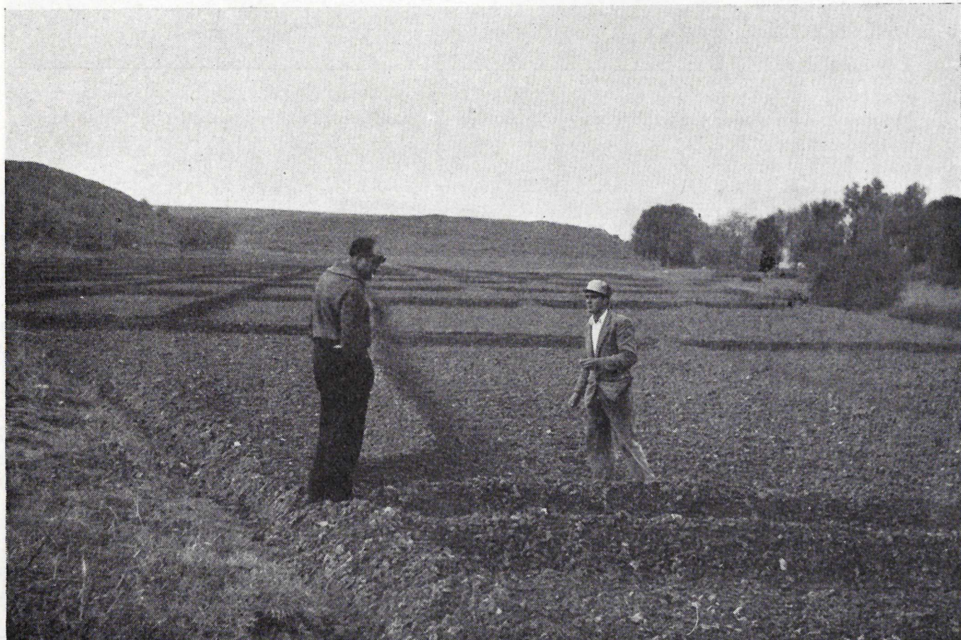
Aranjuez.—Preparación de un campo de ensayo de pratenses.

Durante los días 2, 3 y 4, los que estuvo la Feria Móvil de Alimentación Ganadera en