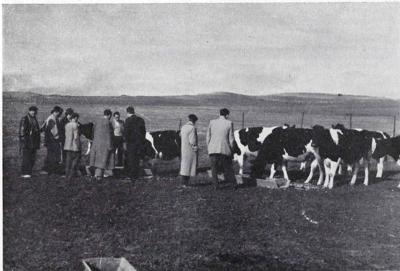
Navalcarnero.—Los ganaderos observan al ganado comiendo el ensilado durante la visita colectiva para ver los resultados de los silos-zanjas en Arroyomolinos.

La AGENCIA DE HARO (Logroño) ha celebrado cinco reuniones, cuatro de ellas sobre cooperativas y la otra sobre abonado racional, con un total de 284 asistentes.