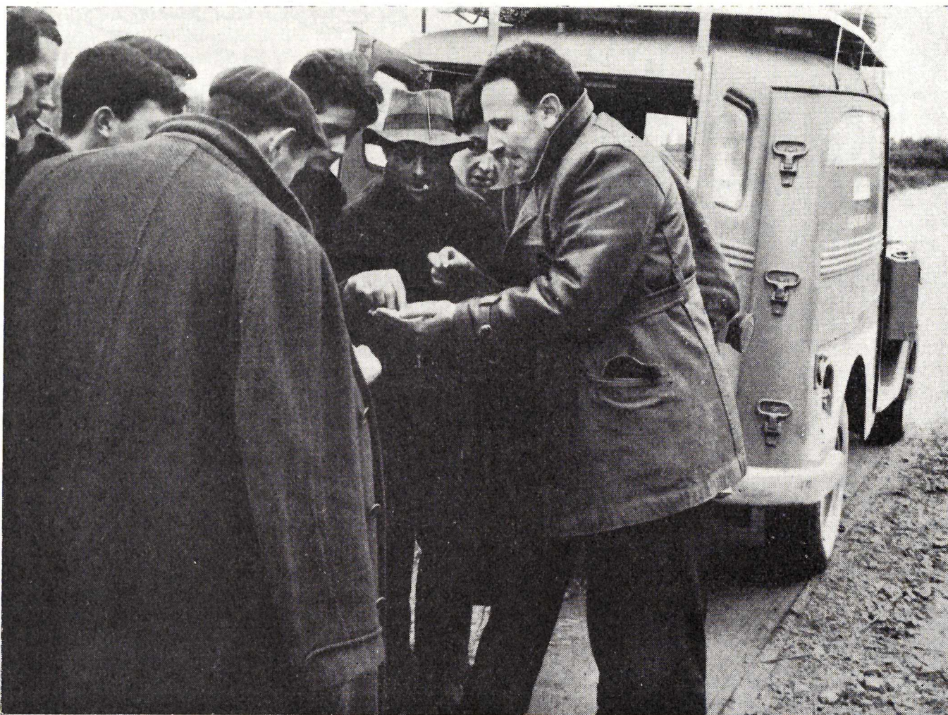
Monforte. —Durante la demostración de abonado en Marcelle, el Agente enseña a los asistentes a distinguir los abonos que se emplearon.

nocer e introducir en la comarca la patata seleccionada de siembra. A tal efecto, se celebraron siete reuniones, a las que asistieron 274 cultivadores, y se efectuaron dos demostraciones de selección y preparación de patatas para siembra, con una asistencia de 55 agricultores. Asimismo se están llevando a cabo las gestiones necesarias para traer y distribuir semilla de cuatro variedades, con la que se realizarán pequeños ensayos privados por unos 100 agricultores de toda la comarca.