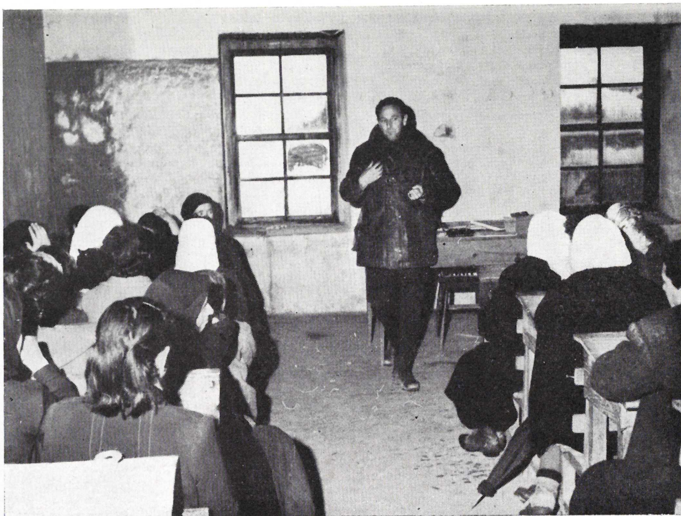
Monforte.—Reunión para mujeres en Marcelle. Se habló sobre silos y pastos artificiales.

Huesca, la AGENCIA DE BARBASTRO (Huesca) ha conseguido realizar tres visitas colectivas, en autobuses, a la misma. Una, organizada por la Cámara Oficial Sindical Agraria de Huesca, con agricultores de Binefar, Monzón y Barbastro; otra, de la Hermandad de Labradores de Barbastro, y la tercera, de los profesores y alumnos del Instituto Laboral. Todas fueron acompañadas por el personal de esta Agencia.