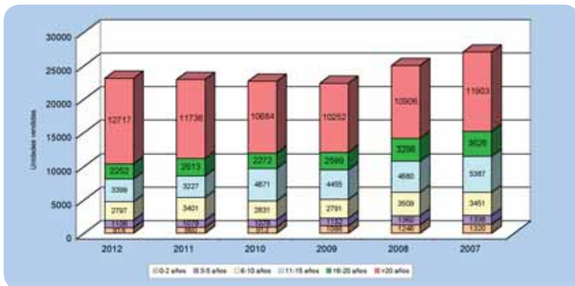
EVOLUCION DE LOS CAMBIOS DE TITULARIDAD DE TRACTORES, SEGUN ANTIGÜEDAD DEL VEHÍCULO, EN EL PERIODO 2007-2012

En términos generales, estos datos suponen un estancamiento en los valores que se registraron en los dos ejercicios pasados (2011 y 2010). Aunque hay reconocer que en valores absolutos la transferencia de titularidad ha aumentado, ésta se ha producido, fundamentalmente, en los tractores con una antigüedad superior a los veinte años, lo que no supone una al-