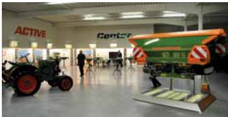
El Active Center es fiel reflejo de la evolución mostrada por la compañía.

(Alemania), la compañía invitó a los representantes de la prensa a recorrer las instalaciones de Altmorhausen, centradas en el montaje de sembradoras y equipos combinados, cuyas partes y componentes proceden en su mayor parte, ya pintadas, de la fábrica de Hude.