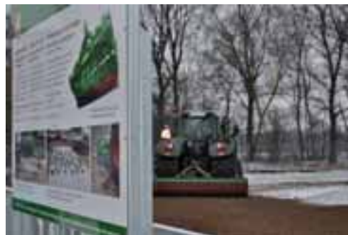
En Altmoorhausen se montan implementos de grandes dimensiones y, en el exterior, dispone de una zona de ensayos.

Para conseguirlo, la compañía apelará a criterios de sostenibilidad, basados en una mayor eficiencia y una mayor seguridad financiera, gracias a la seguridad que ofrece el mantenerse como una multinacional independiente de propiedad familiar. El directivo destacó también el papel que juegan los denominados “socios de ventas,” con los que seguirá manteniendo una estrecha colaboración, ya que “son nuestros embajadores con el cliente final.”