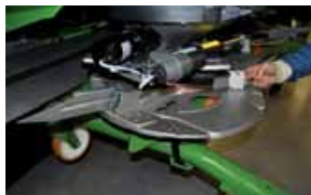
El innovador sistema Auto TS, con agitadores eléctricos que dejan de girar en las cabeceras, busca un abonado preciso en los bordes.