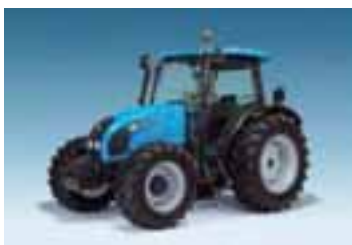
Powerfarm 4 modelos Desde 74 hasta 102 CV 4 cilindros Perkins