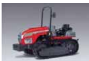
T-F / T-M 4 modelos Desde 74 hasta 99 CV 4 cilindros Perkins