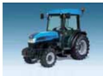
Rex V S 1 modelo 83 CV 4 cilindros Perkins