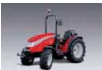
GM 4 modelos Desde 35 hasta 54 CV 3 y 4 cilindros Yanmar