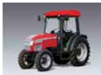
Serie N V 1 modelo 83 CV 4 cilindros Perkins