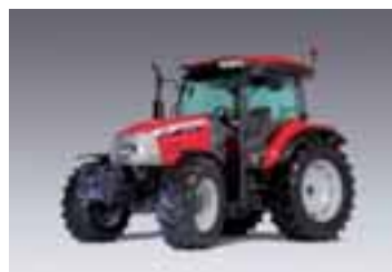
X60 4 modelos Desde 92 hasta 121 CV 4 cilindros Perkins