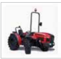
VP6600 2 modelos Desde 54 hasta 66 CV 4 cilindros Perkins/JD