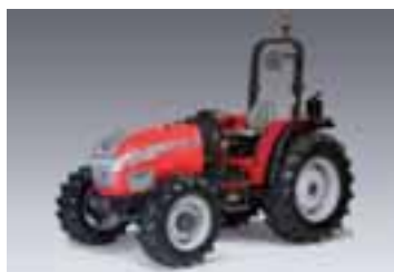
CL 2 modelos Desde 68 hasta 74 CV 3 y 4 cilindros Perkins