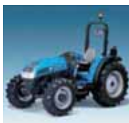
Technofarm 2 modelos Desde 68 hasta 74 CV 3 y 4 cilindros Perkins