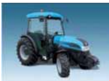
Rex F-GE-GT 7 modelos Desde 68 hasta 110 CV 3 y 4 cilindros Perkins