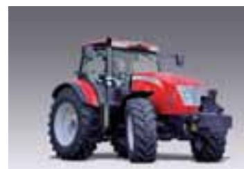
X7.6 Tier 4i 3 modelos Desde 165 hasta 212 CV 6 cilindros Betapower