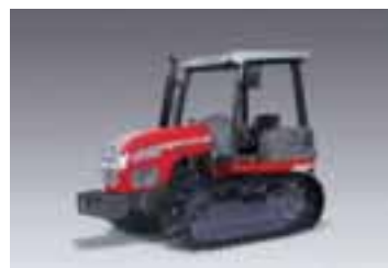
T 3 modelos Desde 83 hasta 99 CV 4 cilindros Perkins