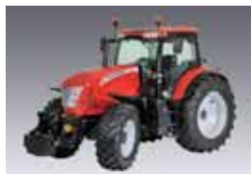
X7.4 Tier 4i 3 modelos Desde 143 hasta 175 CV 4 cilindros Betapower