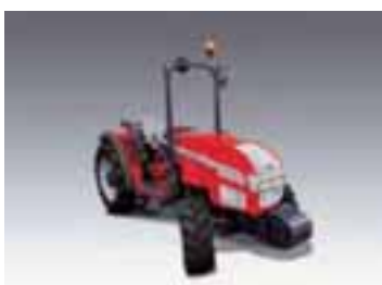
Serie E-line F-GE-XL 4 modelos Desde 68 hasta 83 CV 3 y 4 cilindros Perkins