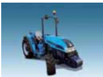
Rex Techno F-GE-GT 4 modelos Desde 68 hasta 83 CV 3 y 4 cilindros Perkins