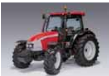
C Max 4 modelos Desde 74 hasta 102 CV 4 cilindros Perkins