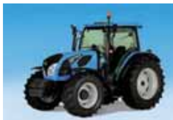
5H (Tier 4i) 4 modelos Desde 85 hasta 113 CV 4 cilindros Perkins