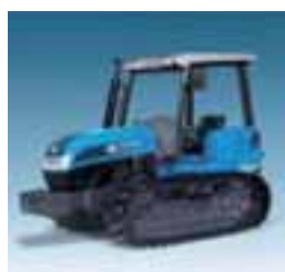
Trekker std 3 modelos Desde 83 hasta 99 CV 4 cilindros Perkins