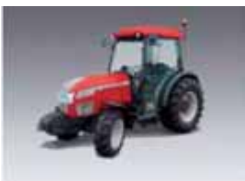
Serie F F-GE-XL 7 modelos Desde 68 hasta 110 CV 3 y 4 cilindros Perkins