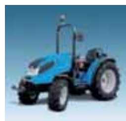
Mistral 4 modelos Desde 35 hasta 54 CV 3 y 4 cilindros Yanmar