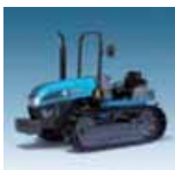
Trekker CF 4 modelos Desde 74 hasta 99 CV 4 cilindros Perkins