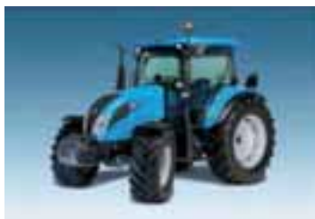
Powermondial 3 modelos Desde 102 hasta 121 CV 4 cilindros Perkins