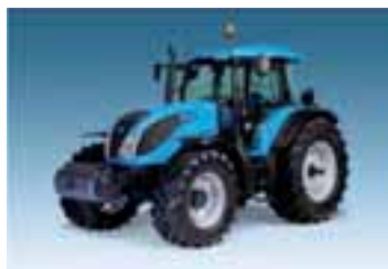
Landpower 4 modelos Desde 117 hasta 157 CV 6 cilindros FPT