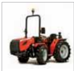
VP4600 3 modelos Desde 25 hasta 48 CV 3 y 4 cilindros Perkins