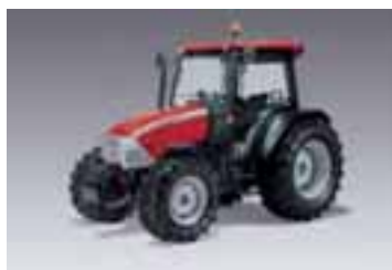
CX-L 3 modelos Desde 69 hasta 81 CV 4 cilindros Yanmar