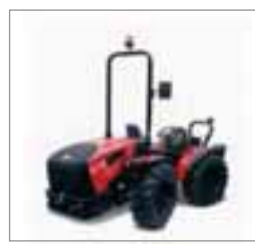
VP9600 2 modelos Desde 82 hasta 101 CV 4 cilindros Cummins