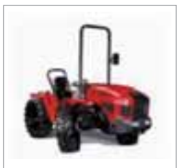
VP6400 3 modelos Desde 46 hasta 66 CV 4 cilindros Perkins /JD