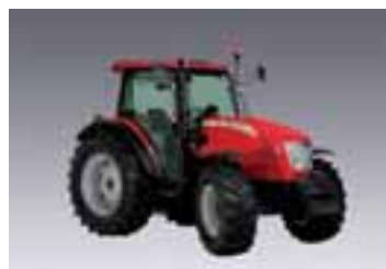
X50 Tier 4i 4 modelos Desde 85 hasta 113 CV 4 cilindros Perkins