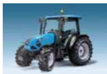
Alpine 3 modelos Desde 69 hasta 81 CV 4 cilindros Yanmar