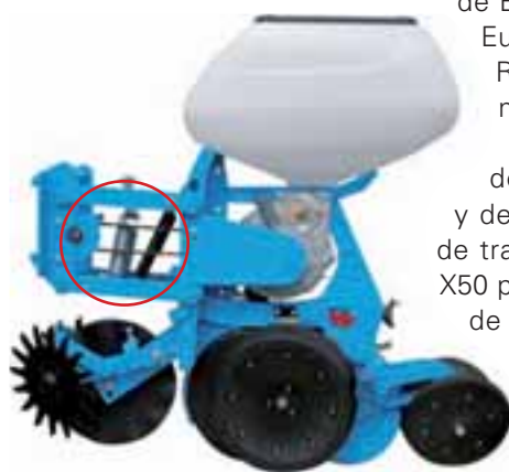
El amortiguador Monoshox es una de las grandes novedades técnicas introducidas en las sembradoras Monosem.

Por otro lado está el sistema Econov. Sulky, es el único fabricante que dispone de este sistema, en el que gestiona el reparto de la capa de abono te-