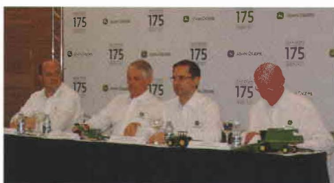
Directivos de John Deere durante la conferencia de prensa celebrada en Ribeirão Preto.