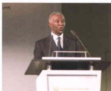
Thabo Mvuyelwa Mbeki, ex-Presidente de Sudáfrica.

desarrollo de granjas modelo y centros de formación en Zambia, Etiopía, Marruecos, Libia, Argelia y Sudáfrica, que permitan a los agricultores y distribuidores locales recibir capacitación sobre la nueva tecnología agrícola.