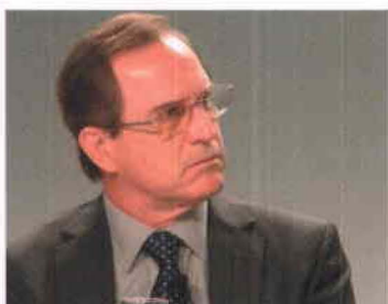
Luiz Fernando Furlan, miembro del Consejo BRF-Brasil Foods S.A. y Telefónica, S.A., ex-ministro de Desarrollo Industrial y Comercio Exterior.