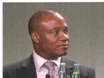
José Condugua António Pacheco, Ministro de Agricultura de República de Mozambique.