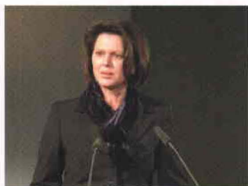
Ilse Aigner, Ministra de Agricultura y Protección al Consumo de Alemania.