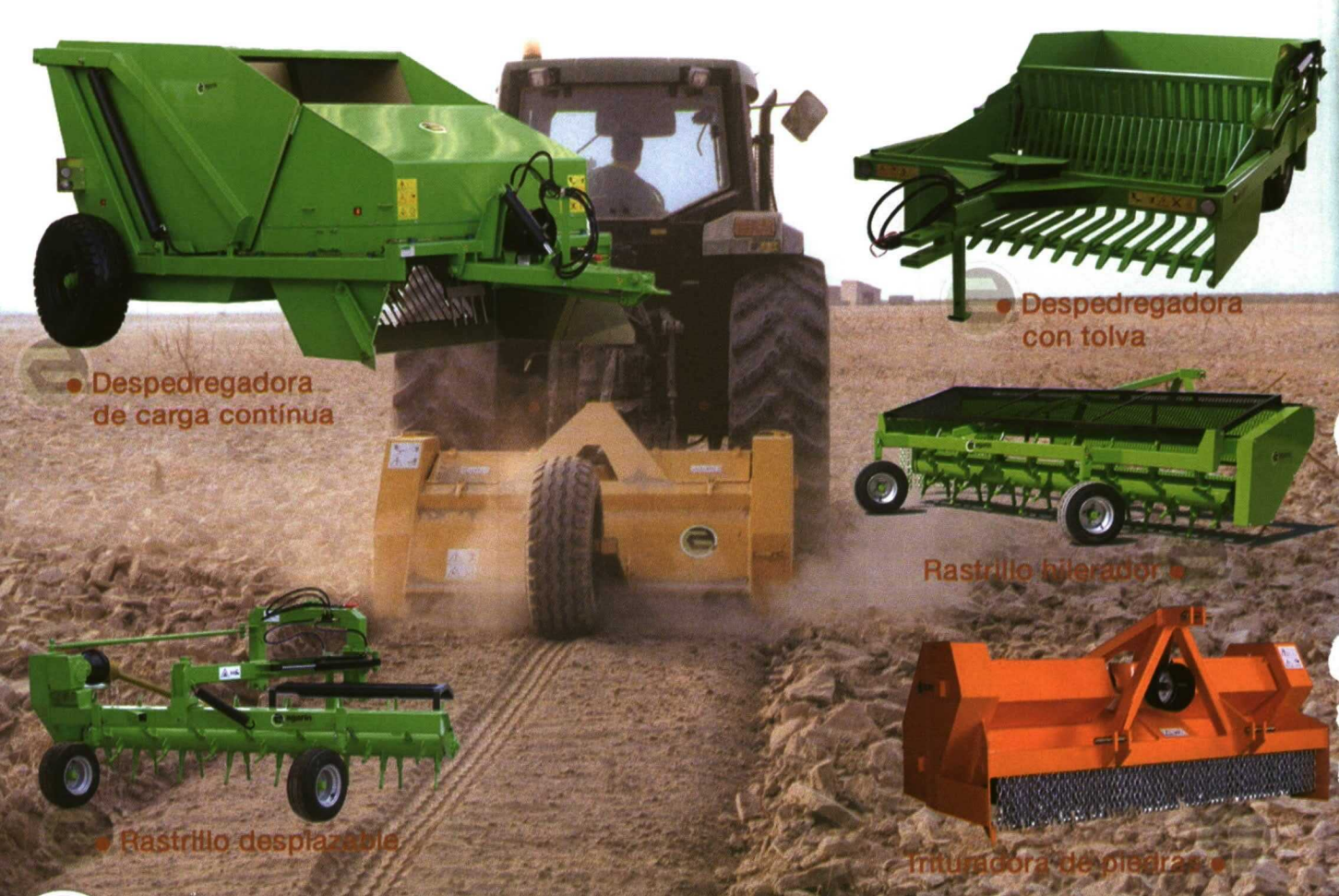
● Despedregadora de carga continua

A continuación se situarían los tractores 'grandes' (GG) y 'muy grandes' (MG), que han supuesto un 19.1% y un 13.7% de los modelos seleccionados, seguidos de los modelos que pertenecen a los segmentos de 'muy pequeños' (MP) y 'pequeños' (PP), que han significado un 8.9% y un 4.7% de los tractores considerados, respectivamente. ■