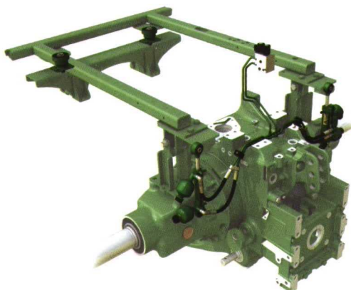
Sistema de suspensión de la nueva cabina de la serie 6R.