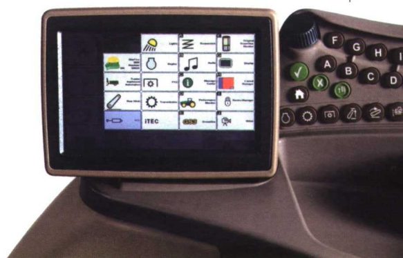
Monitor de color CommandCenter GS3.

El nuevo monitor de color de 7" CommandCenter GS3 es fácil de leer y manejar, en especial en la versión de pantalla táctil opcional con capacidad de vídeo para el monitoreo continuo de los implementos traseros. El exclusivo Control Total del Equipo (iTEC) permite al conductor automatizar todas las funciones en cabeceros. Ambas versiones de la pantalla CommandCenter son compatibles con ISOBUS y per-