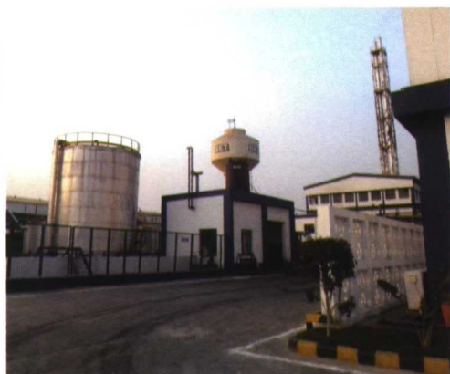
Fábrica de Chopanki.