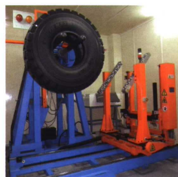
Las imágenes superior e inferior muestran cómo se trabaja en el Departamento de I+D.