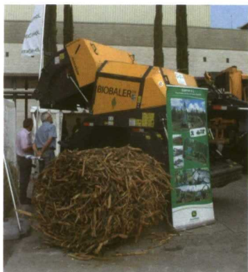
Rotoempacadora para material leñosos.

Con estas perspectivas se espera una notable evolución de la maquinaria que puede intervenir en los procesos de recolección y procesado de la madera con fines energéticos, adaptándose a las diferentes situaciones del medio en el que se produce, con distintos grados de automatización en función de las condiciones socioeconómicas de cada región.