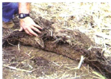
Residuo que queda en el campo (T. C. Ripoli).