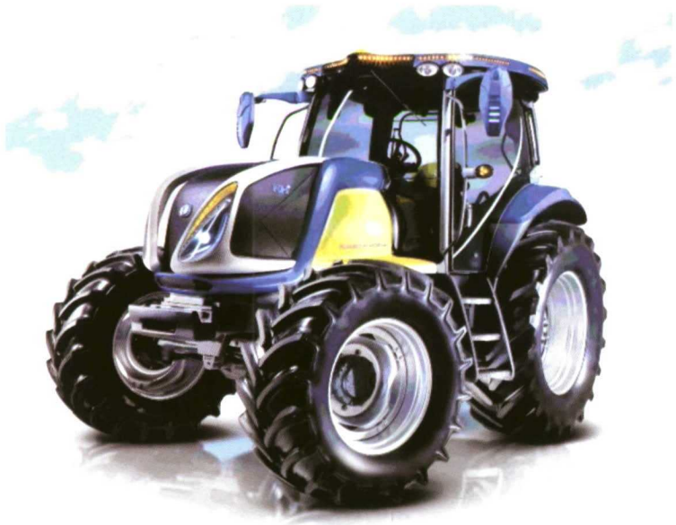
Tractor experimental con pila de combustible alimentada con hidrógeno (New Holland).

El hidrógeno como biocombustible puede obtenerse de distintas maneras (biogás, digestión anaerobia, gasificación), o a partir de la energía eléctrica generada mediante paneles solares o aerogeneradores (electrólisis). Puede utilizarse en motores mezcla-