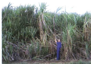
Desarrollo de la caña de azúcar (T. C. Ripoli).

La caña de azúcar es particularmente favorable, ya que es una especie vegetal con alta capacidad fotosintética, siendo capaz de convertir alrededor de 1% de energía solar incidente en biomasa con un alto volumen de sacarosa, que es muy fácil de fermentar y convertir en etanol. Las condiciones de Brasil para cultivar la caña son muy favorables, y se ha desarrollado una tecnología industrial para el aprovechamiento del etanol producido co-