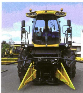
Cabezal SCR para la siega de plantaciones arbóreas en turno corto.