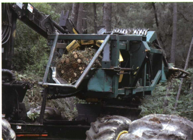
Agavilladora de ramas.

Por otra parte se encuentran las plantaciones especializadas, que ofrecen el mayor potencial. Las especies principales son sauces, álamos y eucaliptos, y las rotaciones que se utilizan van de 1 a 5 años. Los rendimientos anuales están en el rango de 30-35 toneladas por hectárea de material en verde para sauce y álamo en las regiones templadas, pero pueden ser dos veces más elevados en