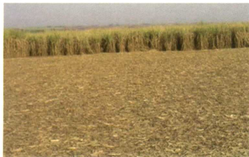
Rastrojo de caña de azúcar.

La biomasa ligno-celulósica se fracciona mediante un pretratamiento específico para obtener sus componentes básicos: hemicelulosa, celulosa, lignina (como exposición al vapor seguida por la hidrólisis enzimática), llegando a un gas constituido básicamente por H 2 y CO, y cantidades diferentes de contaminan-