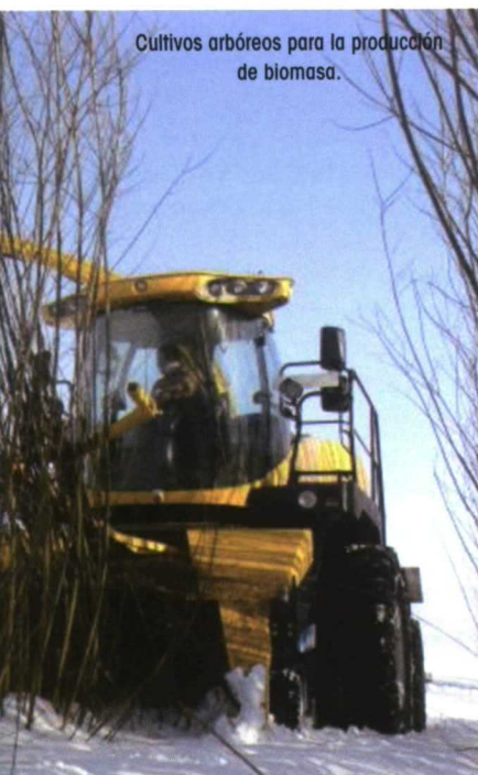
Cultivos arbóreos para la producción de biomasa.