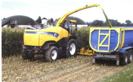
Picado de maíz para ensilado.

Se conocen diferentes tecnologías para producir biogás, que dependen del contenido de